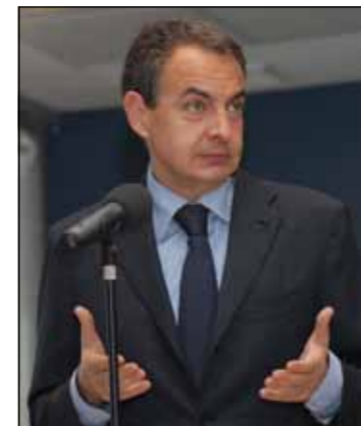
Luis Rodriguez Zapatero

Avionul în care trebuia să se întoarcă, marți 24 iunie, din Togo premierul Spaniei, Jose Luis Rodriguez Zapatero, a ratat decolarea din cauza unei defecțiuni tehnice, provocate se pare de țânțarii și de căldură.