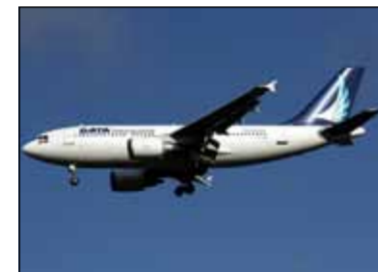
a decis, conform procedurii, să aterizeze pe cel mai apropiat aeroport, la Madrid. Aterizarea s-a derulat în siguranță”, a

„Comandantul a observat o fisură minoră la unul din cele șapte straturi ale parbrizului și