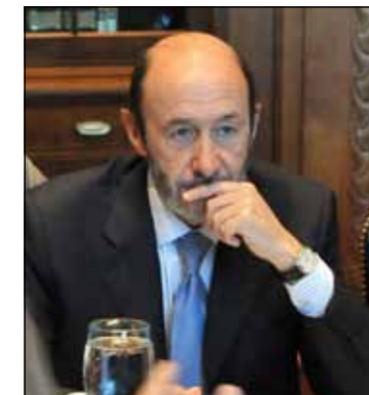
Alfredo Perez Rzbalcaba - ministrul de Interne al Spaniei

Singura reacție a venit chiar din partea ministrului Alfredo Perez Rubalcaba care a fost interviuat la o emisiune de mare audiență „Herrera en la Onda” de către realizatorul radio de la Onda Cero, Carlos Herrera. Rubalcaba a acordat puțină credibilitate datelor publicate de ABC și pe lângă asta a luat