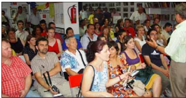
Aniversario en el CEPI de Alcalá de Henares

El Centro Hispano-Rumano de Alcalá de Henares celebró el viernes, 19 de junio, su tercer aniversario – un momento de mucha alegría y satisfacción de poder haber llegado a este punto de su trayectoria.