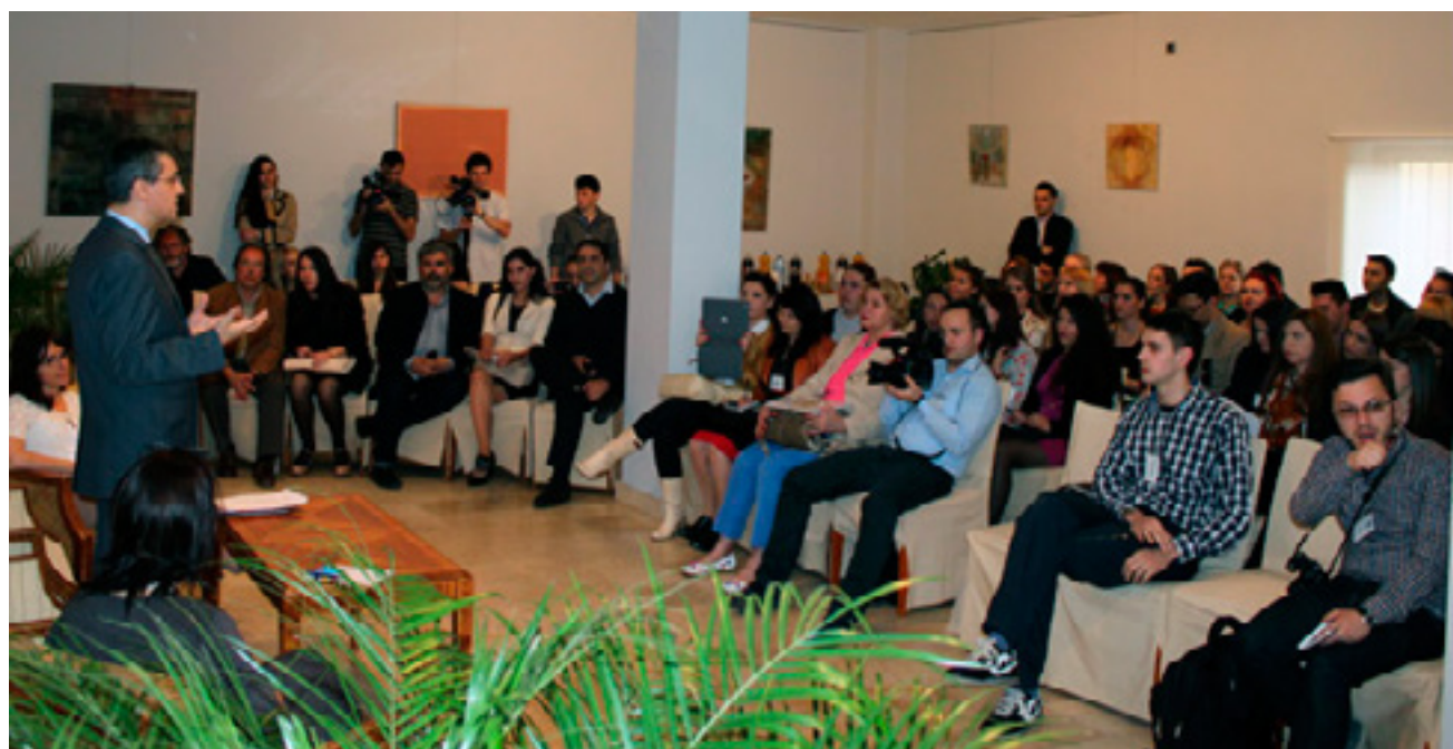
Studenții au primit o „lecție” la Ambasadă

60 de studenți în comunicare și jurnalism din România au participat la dezbateri la sediul Ambasadei României la Madrid, scrie pagina web a misiunii. La 24 aprilie 2013, Ambasada României la Madrid și-a deschis porțile unui grup de 60 de studenți în comunicare și jurnalism, din cadrul universităților Hyperion din București, Babeș-Bolyai din Cluj-Napoca și Danubius din Galați, participanți la proiectul VEHMED (Vehicule media pentru formarea abilităților practice, televiziuni și ziare operate de studenți pentru formarea profesională a studenților), program european cofinanțat din Fondul Social European, prin programul POSDRU, sub tema „Investește în oameni!”.