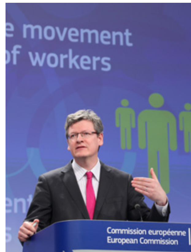
Laszlo Andor, comisar european pentru muncă

De exemplu, se întâmplă ca administrațiile publice sau întreprinderile să aplice reguli discriminatorii de recrutare, cote sau alte cerințe naționale pentru diverse tipuri de posturi. De asemenea, normele în materie de salarizare și promovare pot fi diferite în cazul