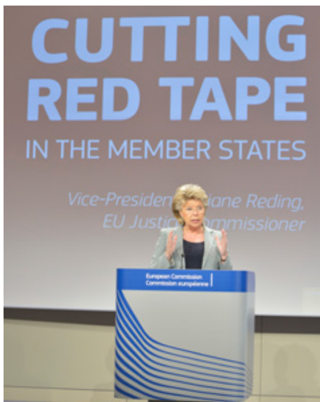
Vicepreședintele Viviane Reding, comisarul UE pentru justiție

„De fiecare dată când treceti frontiera, nu trebuie ca Ministerul de Externe să confirme că pașaportul dumneavoastră este într-adevăr un pașaport — de ce ar trebui să se procedeze așa pentru un certificat de naștere? Atunci când vă mutați în străinătate, îndeplinirea acestor formalități costisitoare pentru a stabili că certificatul dumneavoastră de naștere este într-adevăr un certificat de naștere sau doar pentru a putea utiliza certificatul unei întreprinderi creează inconveniente de ordin