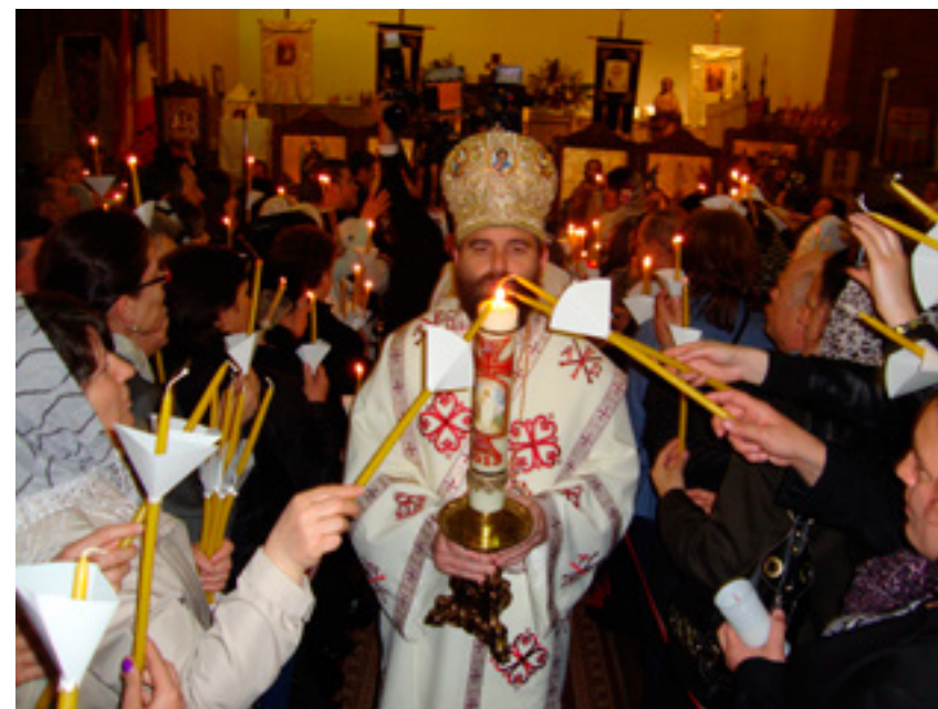
Preasfințitul Timotei, Episcopul Spaniei și Portugaliei

„Madrid este nu numai o regiune cosmopolită, ci și foarte deschisă. Nu întrebăm pe nimeni de unde vine și unde merge, ci oferim fiecărei persoane condiții să își desfășoare viața în libertate. Comunitatea românească este cea mai importantă din regiunea noastră, cu peste 200.000 de persoane, care se simt integrate aici. Unul dintre cinci români care trăiesc în Spania locuiește în regiunea noastră și un sfert dintre ei sunt în regiunea Corredor del Henares, în Estul Madridului. Au