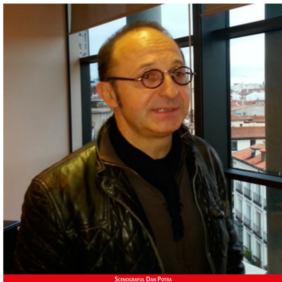
SCENOGRAFUL DAN POTRA

Teatro Real din Madrid aduce pe scena un