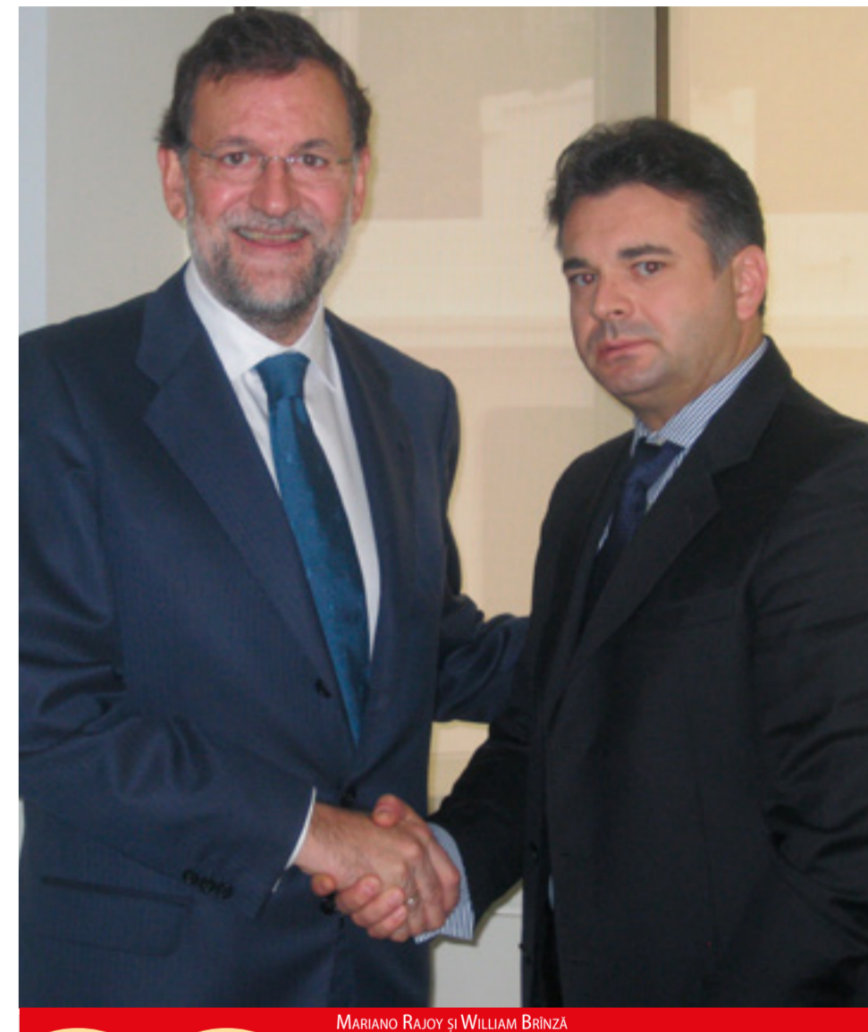
MARIANO RAJOY ȘI WILLIAM BRÎNZĂ

- Nu am reușit să determin o poziție clară a statului român față de românii din străinătate. Ambasadele și consulatele s-au reformat prea puțin. Mă doare atitudinea unor funcționari din Consulate față de români. Aceștia nu au înțeles că „stăpânul” lor este Românul. În noul mandat voi continua să fiu alături de românii mei din străinătate și împreună vom elimina orice derapaj al funcționarilor din Ambasade și Consulate.