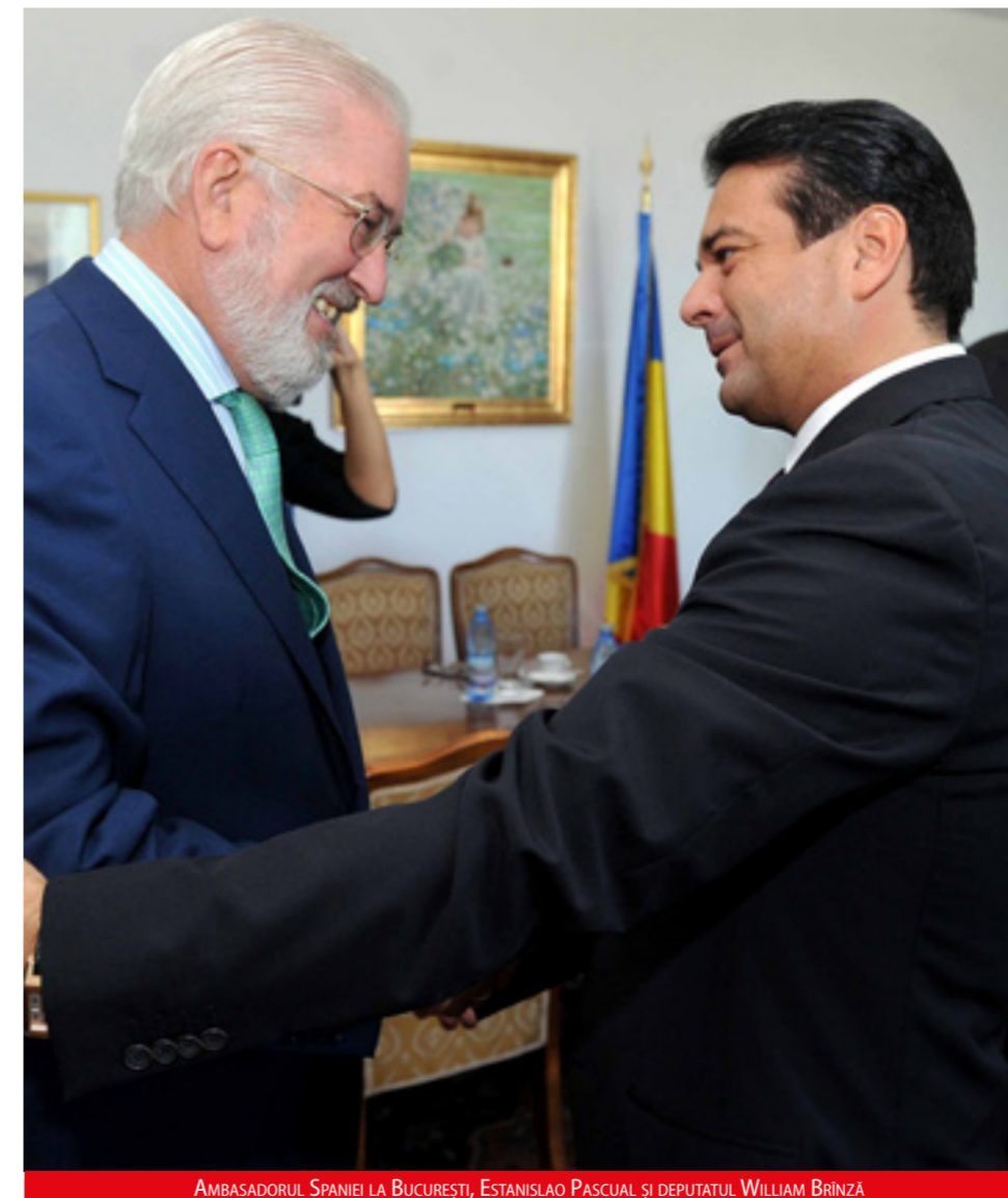
AMBASADORUL SPANIEI LA BUCUREȘTI, ESTANISLAO PASQUAL ȘI DEPUTATUL WILLIAM BRÎNZĂ

- O să-l aveți contracandidat din partea USL pe Victor Socăciu. Nu vă temeți că o să vă „încânte” alegătorii? - Respect orice contracandidat, orice idee a acestuia pentru comunitatea românească. Eu sunt în fiecare week-end într-o comunitate românească. Am întâlniri cu mii de români. Îi provoc pe contracandidații mei să vină la una din aceste întâlniri, unde, în fața a mii de români, să avem o dezbateră despre un proiect coerent pentru români.