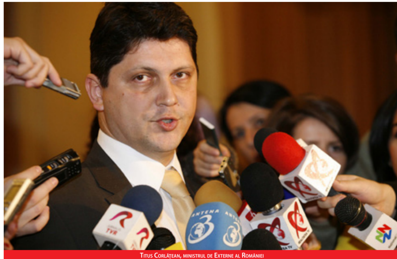
TITUS CORLĂȚEAN, MINISTRUL DE EXTERNE AL ROMÂNIEI

Ministrul Afacerilor Externe, Titus Corlățean, a afirmat recent că MAE a adoptat o strategie care vizează stimularea participării comunităților românești din străinătate la proiectul „o singură Românie”.