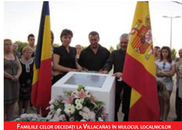
FAMILIILE CELOR DECEDEȚI LA VILLACAÑAS ÎN MILOCUL LOCALNICILOR

Placa a fost dezvelită pe Calle Quero, în apropierea locului accidentului,