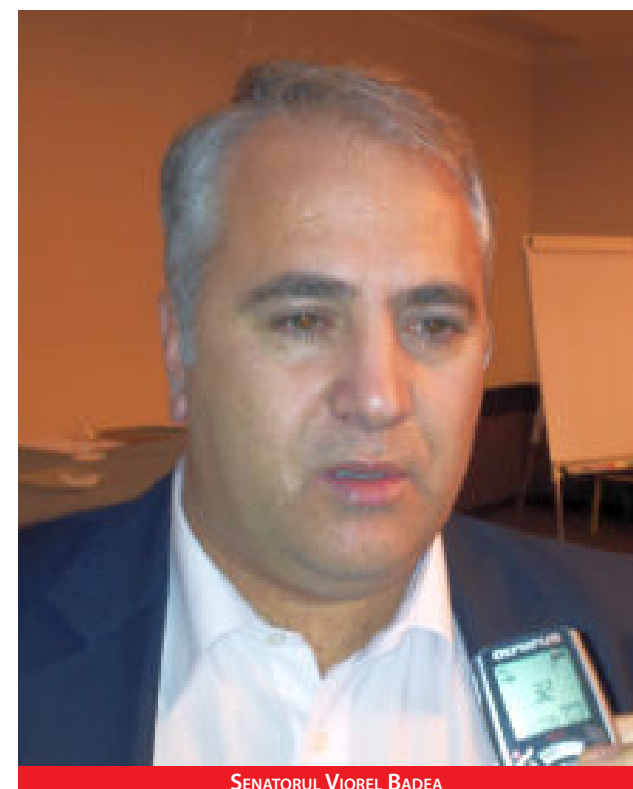
SENATORUL VIOREL BADEA

PDL-ul pierde un senator în diaspora. Senatorul pentru Diaspora, Viorel Badea, a anunțat luni, 7 mai, ca trece de la PDL la PNL. Senatorul Badea a făcut anunțul în plenul Senatului precizând că va intra în grupul parlamentar al PNL.