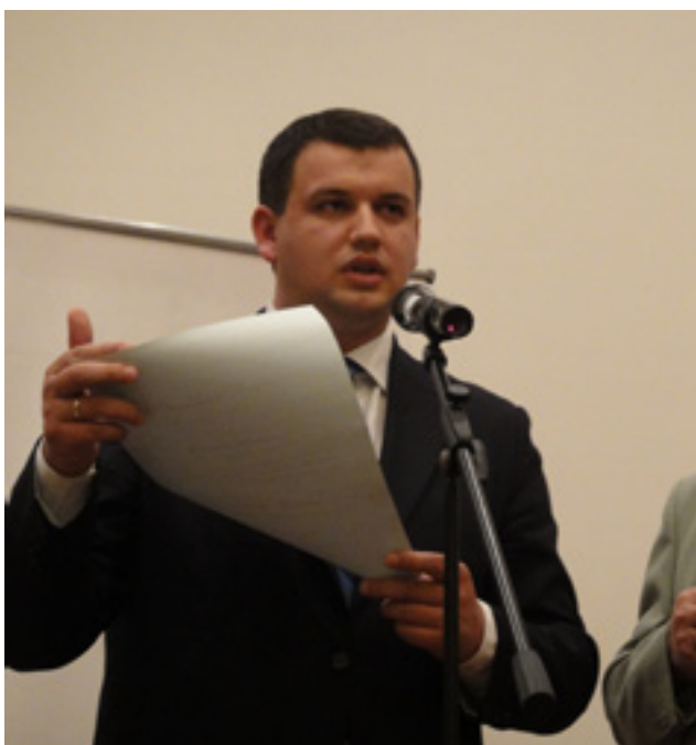
EUGEN TOMAC, FOSTUL SECRETAR DE STAT PENTRU ROMÂNII DE PRETUTINDENI

Curtea de Conturi din România a realizat recent un control asupra activităților, din ultimii doi ani din diaspora, finanțate de Departamentul pentru Românii de Pretutindeni din cadrul guvernului României. Potrivit publicației Gazeta Românească din Italia, instituția de control a descoperit mai multe nereguli legate de acordarea subvențiilor sau a unor premii în bani pentru anumite organizații și persoane din străinătate. Jurnaliștii de la „Gazeta Românească” citează mai multe nereguli semnalate de inspectorii de la Curtea de Conturi în raportul încheiat în 30 aprilie.