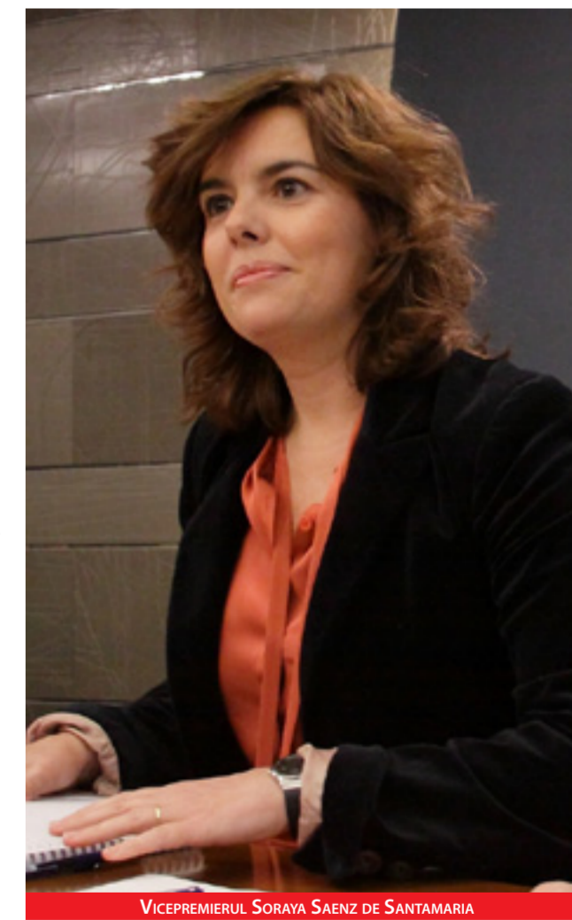
VICEPREMIERUL SORAYA SAENZ DE SANTAMARIA

Numai din salariile directorilor se economiseste 1 milion de euro pe an. De aceea, 40 de companii care nu mai sunt nici rentabile și nici justificate vor fi restructurate. 24 dintre ele vor fi desființate, precum Societatea pentru închirieri imobiliare sau Comitetul pentru Privatizarea Loteriei. Altele vor fi comasate, iar multe alte parteneriate public-