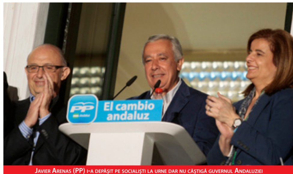
JAVIER ARENAS (PP) I-A DEPAȘIT PE SOCIALIȘTI LA URNE DAR NU CĂȘTIGĂ GUVERNUL ANDALUZIEI

Majoritatea o au acum forțele de stânga, Partidul Socialist și Partidul Stânga Unită, de la care se așteaptă