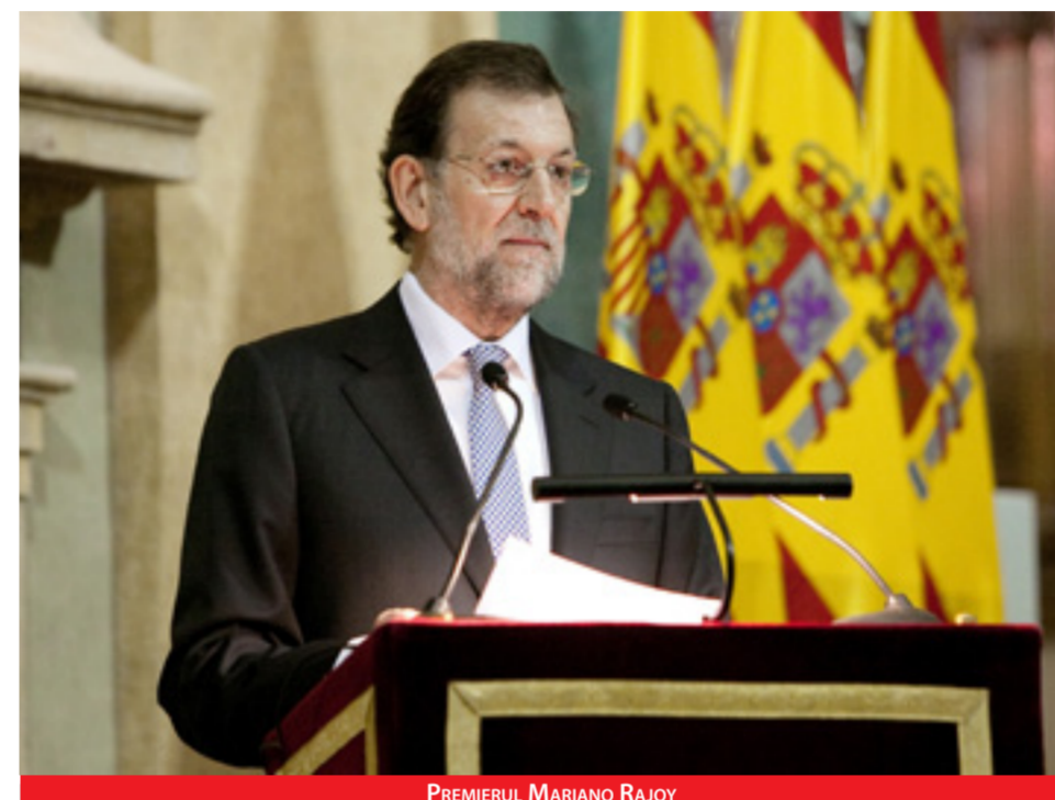
PREMIERUL MARIANO RAJOY

Guvernul conservator condus de Mariano Rajoy a început un adevărat tur de forță al măsurilor anticriză încă din ultimele zile ale lui 2011, când Partidul Popular a preluat puterea în Spania.