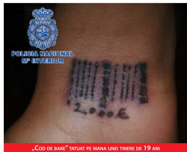
„COD DE BARE” TATUAT PE MANA UNEI TINERE DE 19 ANI

„Toate fetele au fost racolate în România. Sunt înșelate cu false oferte de muncă și când ajung aici le obligă să se prostitueze și să plătească o datorie creată pentru transportul până în Spania”, ne-a precizat un polițist spaniol din cadrul UCRIF Madrid. Poliția nu poate să precizeze care este numărul victimelor acestor rețele, dar ancheta continuă și este posibil să aibă loc noi arestări.