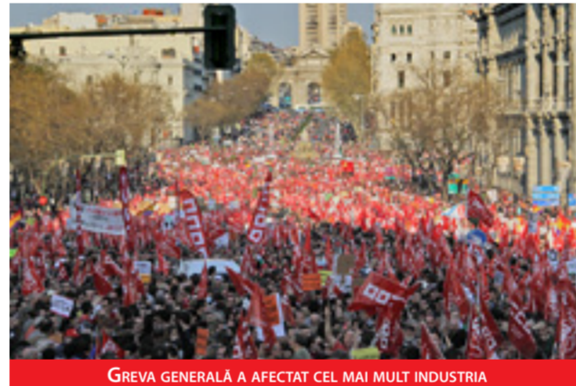
GREVA GENERALĂ A AFECTAT CEL MAI MULT INDUSTRIA

în ultimele 3 trimestre și atunci poate concedia mult mai ieftin (20 de zile pe an).