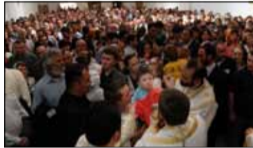
La Zaragoza aproximativ 1500 de români au participat la sfințirea primei biserici ortodoxe

În ultimele zile românii din mai multe regiuni ale Spaniei au primit vești bune în ceea ce privește accesul la slujbele religioase. În Zaragoza a fost sfințită prima biserică ortodoxă, în prezența Mitropolitului Europei de Vest, ÎPS Iosif și a episcopului de Spania și Portugalia, ÎPS Timotei.