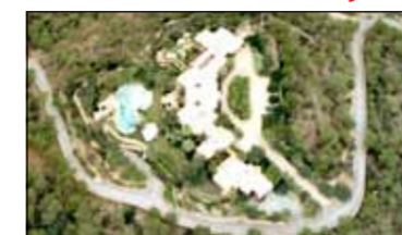
Casa lui Michael Crețu a fost în ultimii ani subiectul reclamațiilor făcute de ecologiști

România a fost invitată pentru prima dată la acest festival al vinului, fiind menționată ca și o potențială piață de desfacere pentru vinurile spaniole. Delegația sosită din partea țării noastre în capitala manchegă a fost alcătuită din importatori, distribuitori, oameni de afaceri din sector și din reprezentanți ai mass media. Tot pentru prima dată, Spania a desemnat și un delegat al FENAVIN pentru România, în persoana