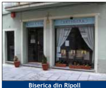
Biserica din Ripoll

În Calatayud sunt înregistrate 4.500 de români, dar se presupune că la noul sediu al bisericii vor putea veni români din mai multe localități precum