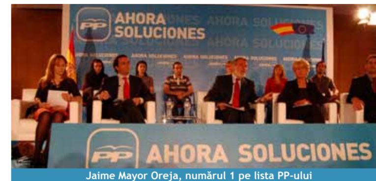
Jaime Mayor Oreja, numărul 1 pe lista PP-ului

candidaților PP-ului cu rezidenții străini. De asemenea, directorul de Imigrație de la primăria din Torrejón de Ardoz a declarat că „se pare că socialiștii au ceva împotriva românilor: mai întâi nu am fost lăsați să muncim prin aplicarea moratoriului și apoi vor să ne dea afară din Spania cu presupusul plan de întoarcere voluntară”, referindu-se la acordurile semnate la București de ministrul muncii, Celestino Corbacho cu omologul său român Marian Sârbu.