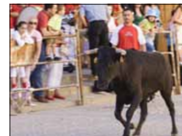
Moartea copilului de 10 a șocat pe toată lumea în Pinseque

Nimeni nu poate să spună cum s-a petrecut tragedia, însă în