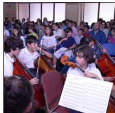
Copii de diferite naționalități au fost protagoniști de Ziua Europei

La 10 mai, în prezența unui numeros public spaniol și român, a avut loc la Conservatorul Regal Superior de Muzică din Madrid ( Real Conservatorio Superior de Musica ), un Concert de muzică europeană organizat de Ambasada României și ICR Madrid, care a cuprins