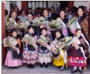
„Mayerele” reprezintă calitățile oricarei femei

Amintiri pentru toată viața Câțiva dintre copiii români care au participat la acest festival vor pleca peste o lună definitiv în România. Vor lua cu ei însă un lucru neprețuit: amintirile legate