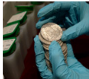
FREGATA TRANSPORTA 595 DE MII DE MONEZI DE AUR ȘI ARGINT

Dupa 5 ani de procese cu firma americana Odyssey, guvernul spaniol este mulțumit că în sfârșit tezaurul se întoarce acasă sau mai bine spus își termină călătoria, care a fost curmată în 1804. În acel an, fregata spaniolă Nuestra Senora de las Mercedes se întorcea cu 600 de mii de monezi de