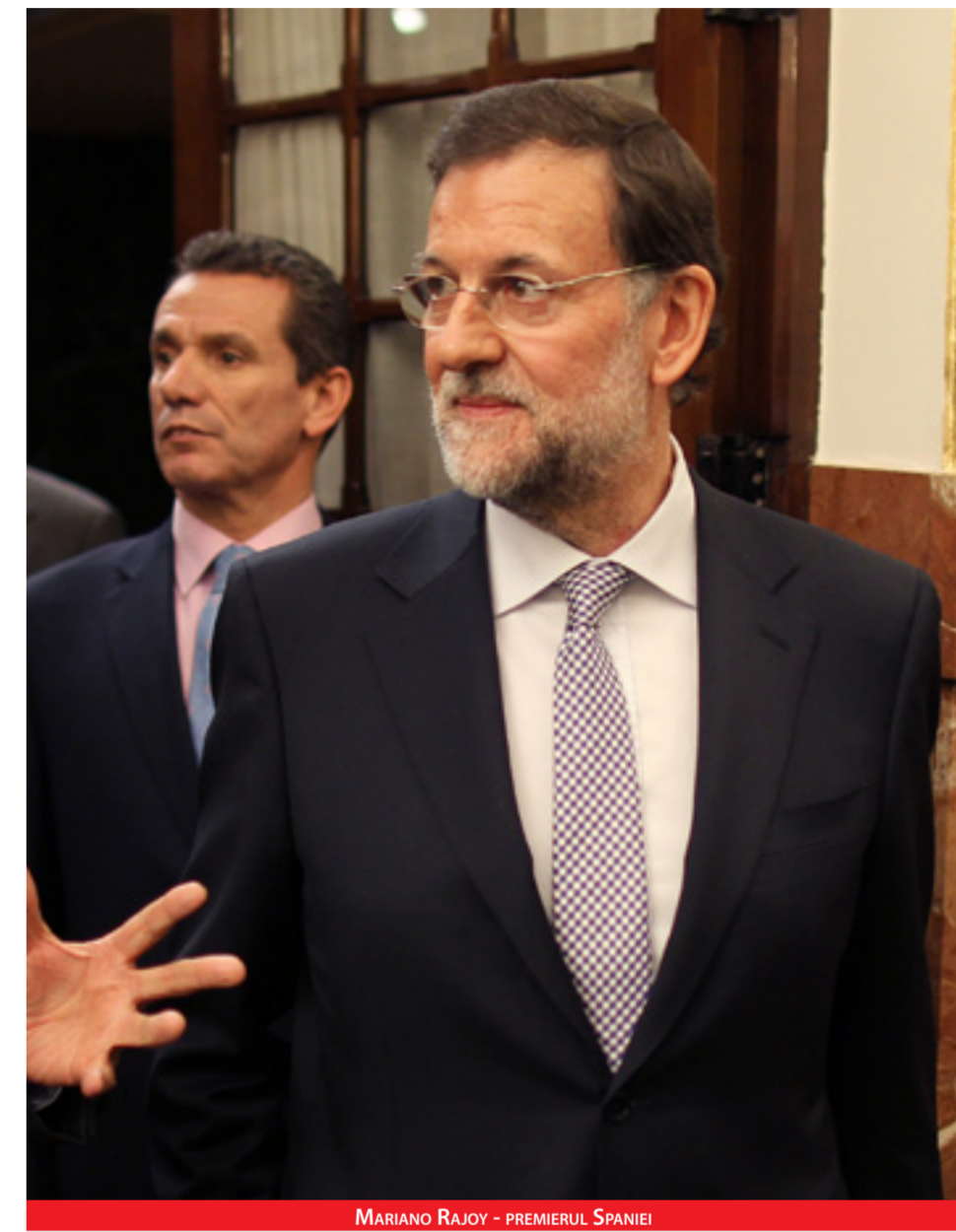
MARIANO RAJOY - PREMIERUL SPANIEI

Între timp, societatea spaniolă se străduiește să asimileze noua realitate a austerității și a protestelor publice masive.