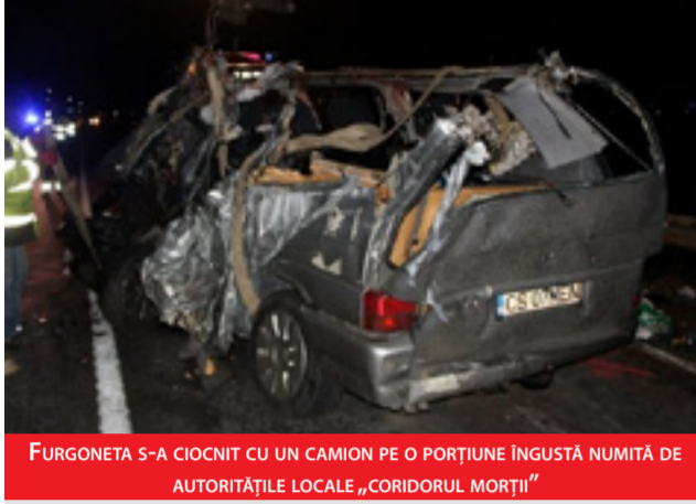
FURGONETA S-A CIOCNIT CU UN CAMION PE O PORȚIUNE ÎNGUSTĂ NUMITĂ DE AUTORITĂȚILE LOCALE „CORIDORUL MORTII”

Cinci români au murit în seara zilei de 19 februarie, într-un accident rutier petrecut pe o șosea din regiunea Girona, în apropierea graniței cu Franța. Furgoneta în care se aflau 8 cetățeni români se îndrepta spre România și s-a ciocnit în jurul orei locale 23:45 cu un camion care circula din sens opus.