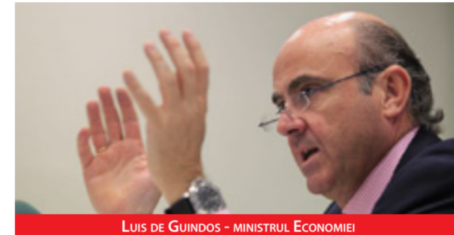
LUIS DE GUINDOS - MINISTRUL ECONOMIEI

pentru foarte mulți spanioli, dar și străini, care au contractat credite ipotecare în ultimii ani ai boom-ului imobiliar, când prețurile locuințelor erau extrem de mari. La ora actuală, șomajul spaniol trece de 5,2 milioane și datele ultimului sondaj privind Populația Activă (EPA) arătau că 1.575.000 de familii din Spania au toți membrii în șomaj. Asociația Persoanelor Afectate de Creditul Ipotecar din Spania estimează că de