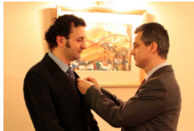
GELU VLAȘIN - DECORAT CU ORDINUL MERITUL CULTURAL ÎN GRAD DE CAVALER

„Titul i-a fost acordat, la propunerea Ministerului român al Culturii, de către Administrația Prezidențială, în semn de apreciere pentru talentul și dăruirea de care a dat dovadă în întreaga sa carieră literară, pentru promovarea culturii românești în lume și implicarea sa constantă în strângerea legăturilor dintre românii aflați peste