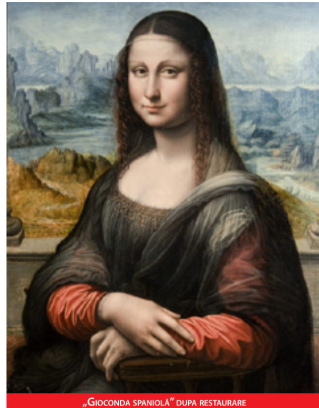
„GIOCONDA SPANIOLĂ” DUPA RESTAURARE

Lucrările de restaurare au fost începute acum doi ani printr-o conjunctură fericită, la solicitarea Muzeului Luvru din Paris, care pregătea o expoziție despre Da Vinci. Treptat, în timp ce era îndepărtat fundalul de culoare neagră au apărut la