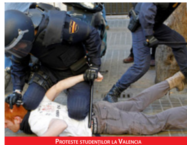
PROTESTE STUDENȚILOR LA VALENCIA

Pe lângă elevi și sindicaliști, nemulțumirea