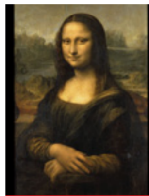
„GIOCONDA” - DE LEONARDO DA VINCI

Gioconda de la Madrid poate fi considerată așadar o rudă apropiată a originalului de la Paris și se crede că au fost pictate în