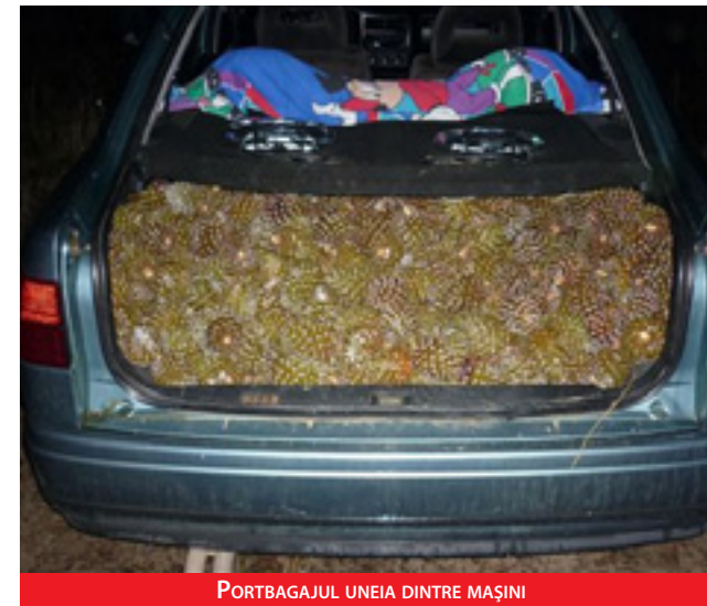
PORTBAGAJUL UNEIA DINTRE MAȘINI

Agenții Gărzii Civile din Valladolid au reținut 4 români care sunt acuzați că au furat 620 de kilograme de ananas. Cei 4 români locuiesc în San Roman de Hornija (Valladolid), potrivit Europa Press, și au fost depistați de Gardă Civilă când ieșeau dintr-o fermă cu două mașini în care se afla o mare cantitate