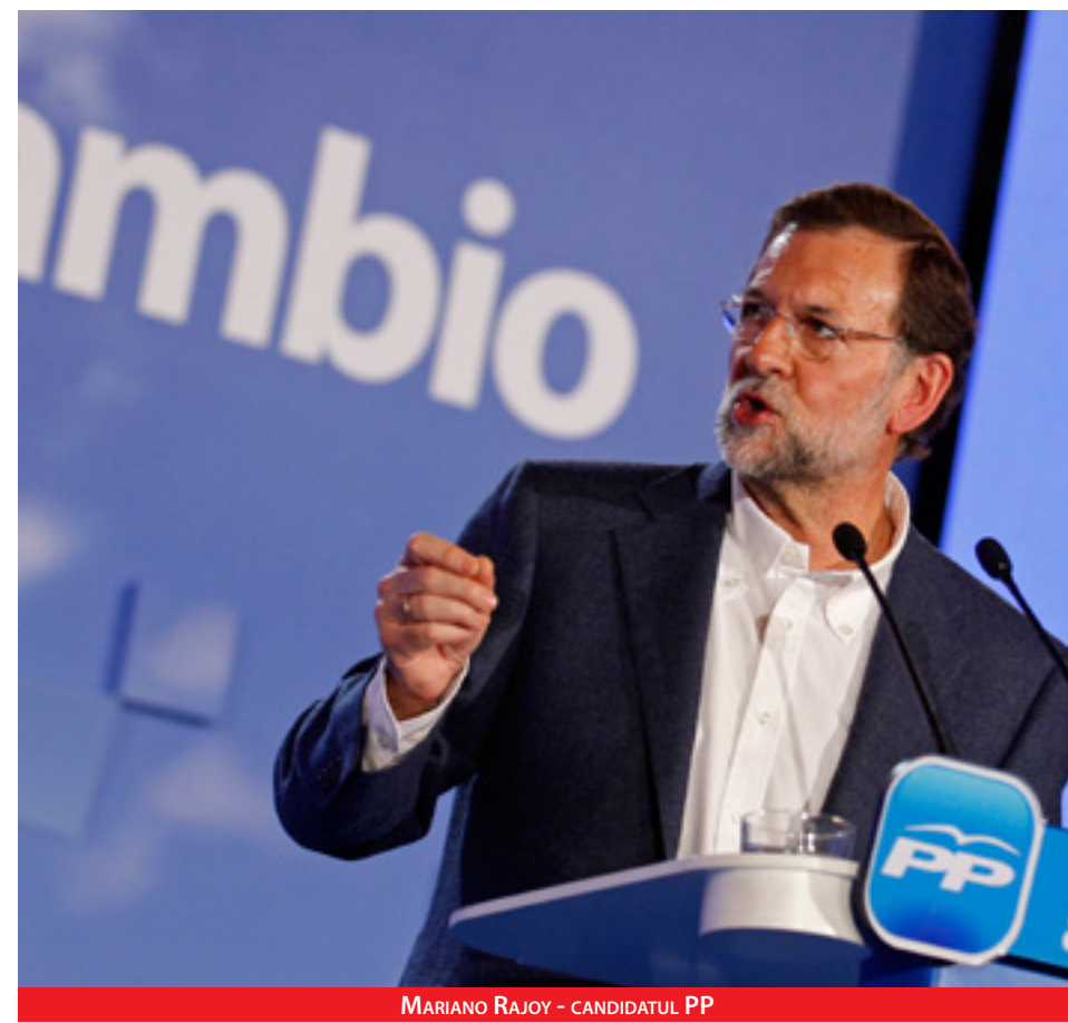
MARIANO RAJOY - CANDIDATUL PP

Spania se pregătește de alegerile generale din 20 noiembrie, iar românii speră ca viitorul guvern să decidă mai curând dacă ridică restricțiile aplicate de la 22 iulie. Deocamdată însă, problemele românilor nu se regăsesc în agendă politică a candidaților, mai ales pentru că la aceste alegeri votează doar cetățenii spanioli. De aceea, orice pronostic referitor la viitorul guvern și la posibilitatea de a scurta perioadă de aplicare a restricțiilor pentru români este destul de riscant.