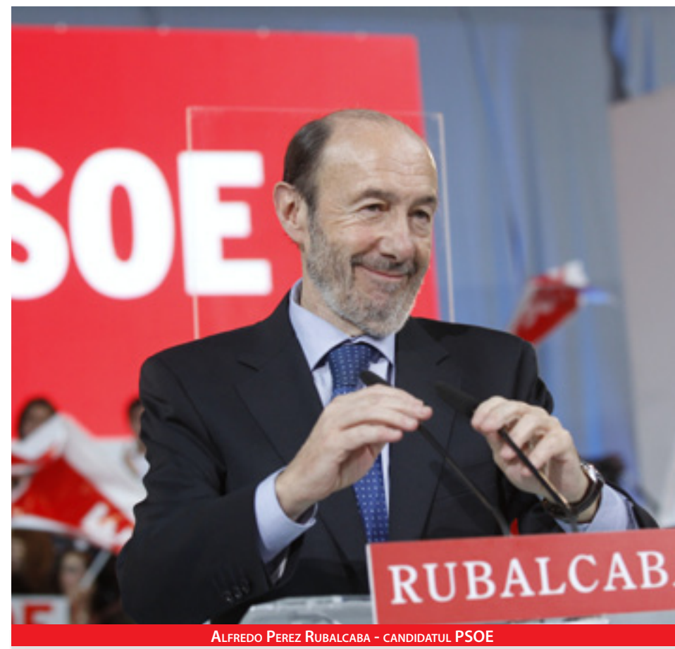
ALFREDO PEREZ RUBALCABA - CANDIDATUL PSOE