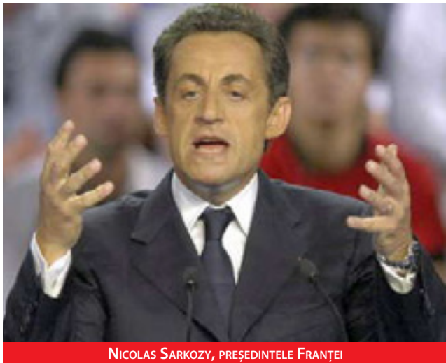
NICOLAS SARKOZY, PREȘEDINTELE FRANȚEI

Franța a încălcat grav Carta Socială a Consiliului Europei prin expulzarea țiganilor români și bulgari în timpul verii anului 2012, după cum a dictat o comisie de drepturi sociale din cadrul organismului european.