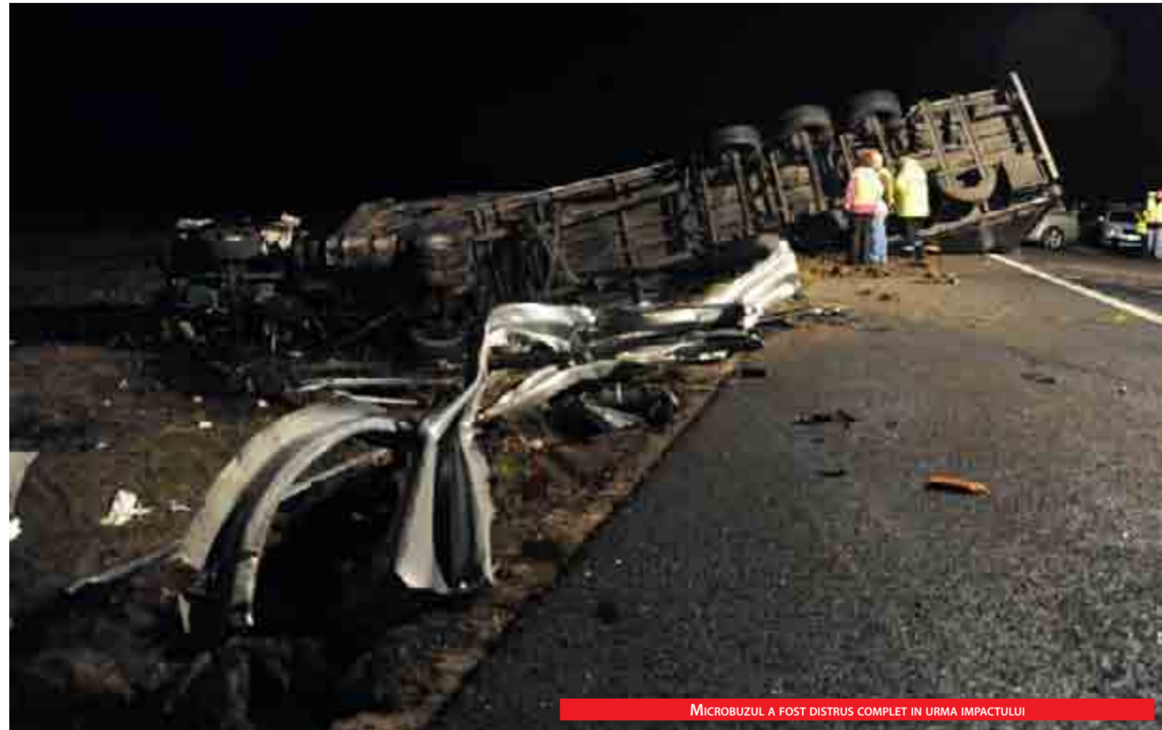
MICROBUZUL A FOST DISTRUS COMPLET IN URMA IMPACTULUI

al microbuzului se află în stare foarte gravă internat la Spitalul Universitar din Szeged, însă medicii sunt rezervați în privința șanselor lui de supraviețuire.