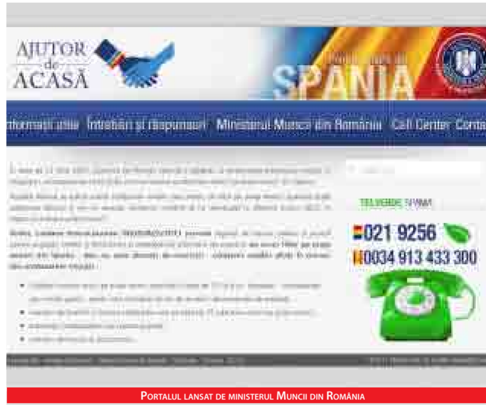
PORTALUL LANSAT DE MINISTERUL MUNCII DIN ROMANIA

Ministerul Muncii din România a lansat din 2 noiembrie un portal web pentru românii din Spania care au nevoie de informații despre restricțiile de muncă, adoptate la 22 iulie.