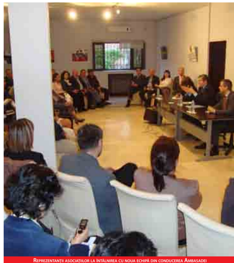
REPREZENTANȚII ASOCIAȚIILOR LA ÎNTÂLNIREA CU NOUA ECHIPĂ DIN CONDUCEREA AMBASADEI

În vederea creșterii eficienței acțiunilor ambasadei privind mediul asociativ, participanții la reuniune au convenit organizarea unor întâlniri periodice, concentrate pe teme punctuale. Totodată, ambasadorul român va avea, în perioada următoare, întâlniri separate cu toți reprezentanții de asociații care au manifestat interes pentru a aborda sau detalia o serie de teme punctuale.