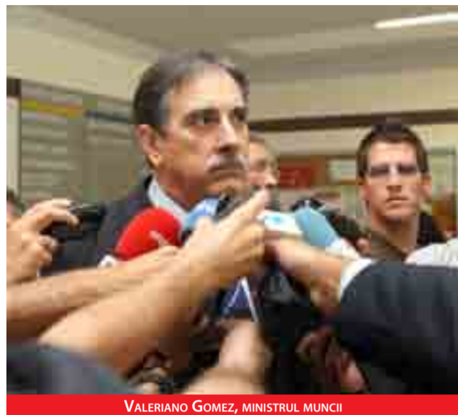
VALERIANO GOMEZ, MINISTRUL MUNCII

mare decât al bărbaților, cu un raport de 114 mii la 32.800.