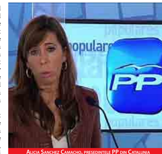
ALICIA SANCHEZ CAMACHO, PREȘEDINTELE PP DIN CATALUNIA

În sesizarea făcută către autoritățile spaniole - executivul local catalan, departamentul pentru imigrație, primăria Barcelonei și conducerea filialei locale a Partidului Popular - au fost condamnate cu