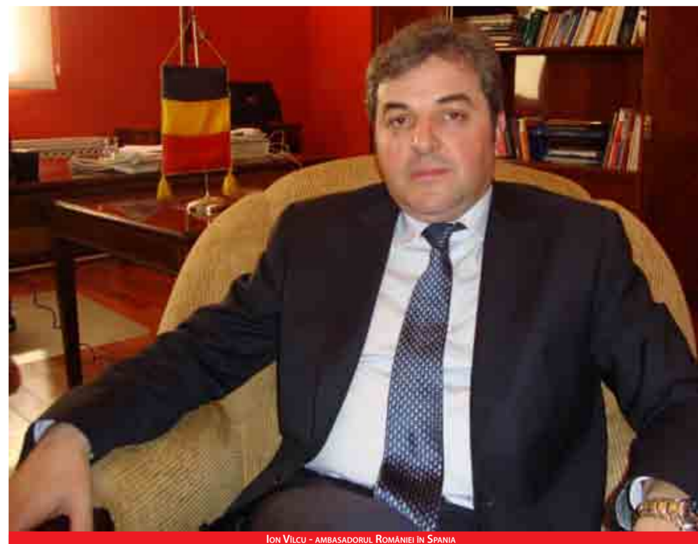
ION VÎLCU - AMBASADORUL ROMÂNIEI ÎN SPANIA

- Preiau conducerea unei Ambasade care este