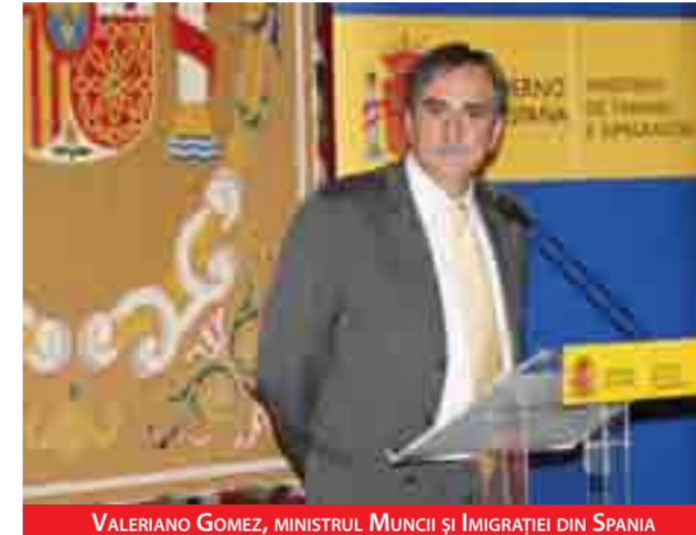
VALERIANO GOMEZ, MINISTRUL MUNCII ȘI IMIGRAȚIEI DIN SPANIA

Măsura îi ajută în special pe românii care au oferte de muncă în agricultură, la cules de căpșuni sau mășline, pentru că acum ei pot să obțină un permis de muncă sezonier