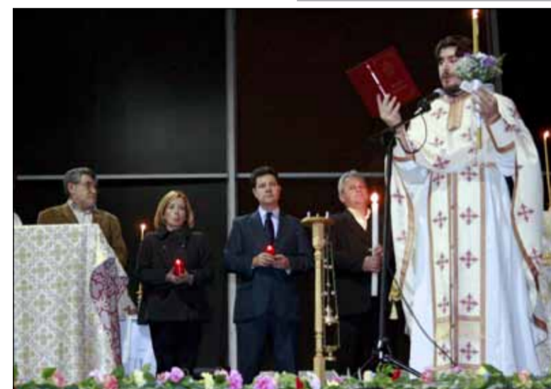
Toledo: Primarul Emiliano García-Page a fost alături de românii care au luat lumină de Paște și în capitala comunității Castilla La Mancha