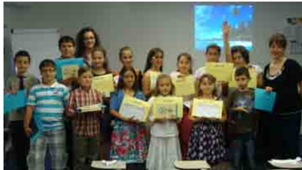
COPII AU FOST RĂSPĂLĂTIȚI CU DIPLOME ȘI CĂRȚI

Luna iunie reprezintă pentru copii și luna în care se încheie cursurile școlare anuale. La Biroul Consiliului Județean Dâmbovița, ziua de 5 iunie a reunit elevi și părinți, veniți pentru a participa împreună la ultima activitate a cursului de limba română desfășurat la sediul acestei instituții. Copiii au făcut un tur de forță, trecând prin toate conținuturile programate pentru acest an școlar și demonstrând părinților și tuturor celor prezenți cât de multe lucruri noi au învățat. Sinonime, antonime, ortograme, sărbători tradiționale, strămoși, Ziua Națională a României, Mihai Eminescu, 1 Martie, Ziua Europei, 1 Iunie, proverbe românești și ghicitori au fost ingredientele unei activități care i-a antrenat pe cei mici, făcându-i dornici să-și etaleze cunoștințele dobândite pe parcursul anului școlar. „Am dat copiilor posibilitatea să-și manifeste și latura artistică, fiecare alegându-și momentul pe care l-a prezentat. Unii au cântat sau au interpretat diferite piese la orgă, alții au dansat, au recitat sau au desenat. În final, doi copii au citit câte o compunere intitulată „Impresii la