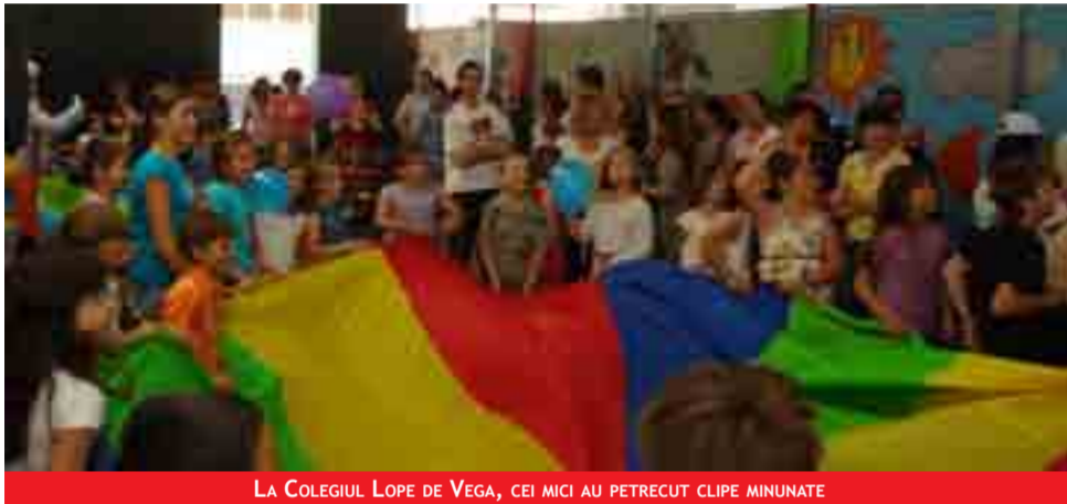
LA COLEGIUL LOPE DE VEGA, CEI MICI AU PREȚECUT CLIPSE MINUNATE

Pentru zeci de copii români înscriși la cursurile de Limbă, Cultură și Civilizație românească în giumbușlucurile clovnilor aduși de Asociația Românilor din Castellon, Valencia și Alicante. La finalul activității ludice organizate la Colegiul Lope Nicolae” a oferit copiilor români câteva ore de voie bună și distracție în aer liber, în parcul Rafalafena, chemându-i să-și sărbătorească ziua