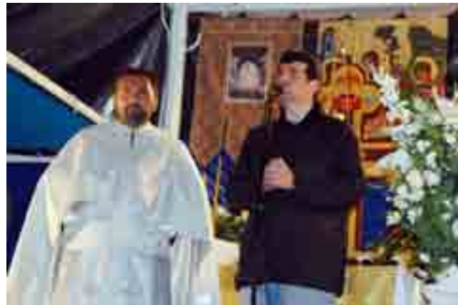
ALCALA DE HENARES

Paștele ortodox a fost sărbătorit în Spania odată cu cel catolic, iar după o săptămână de procesiuni solemne ale fraților catolice, Spania s-a luminat la Înviere, datorită slujbelor din cadrul parohiilor ortodoxe românești. Românii din Spania au sărbătorit Învierea Domnului în cadrul parohiilor românești din Spania care s-au înmulțit în mod semnificativ, în ultimii ani.