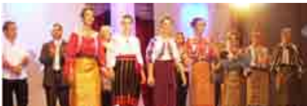
„FLORILE MUNTENIEI”, GRUPUL DE DANS FOLCLORIC AL ASOCIAȚIEI „EUROPA CULTURALĂ”

Pe 11 februarie 2011, în Castellon a luat ființă o nouă asociație românească, „Europa Culturală”. În prezent, în cadrul organizației funcționează un grup de dans folcloric, „Florile Munteniei”, format din opt fete și patru băieți. Asociația colaborează cu soliști de muzică populară și ușoară, cu instrumentiști sau pictori din provincie și intenționează să intensifice relațiile cu aceștia, dar și să extindă colaborările și cu alți reprezentanți ai culturii românești. „Noi întindem o mână tuturor celor care vor să activeze în cadrul asociației noastre, celor care vor să se înscrie în grupul de dans folcloric, tuturor celor talentați care