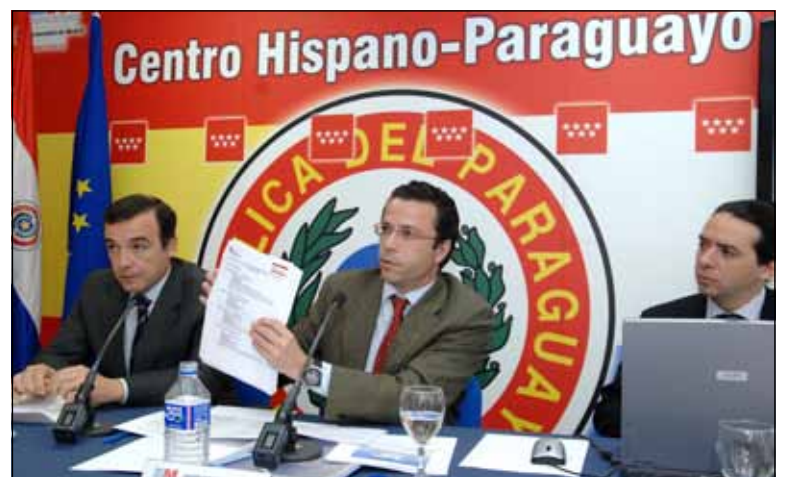
Javier Fernández Lasquetty, ministru regional de Imigrație

România se află pe primul loc în clasamentul țărilor receptoare de bani de la imigranții din regiunea Madridului. Românii din capitală și din împrejurimi au trimis acasă, în 2008, 325 de milioane de euro, potrivit studiului „Trimiteri de bani”, realizat recent de guvernul regional al Madridului, în