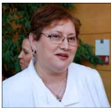
Renate Weber - europarlamentar

La evenimentul la care a participat și eurodeputata liberală Renate Weber, care a lansat un apel către români să meargă la vot în 7 iunie, și