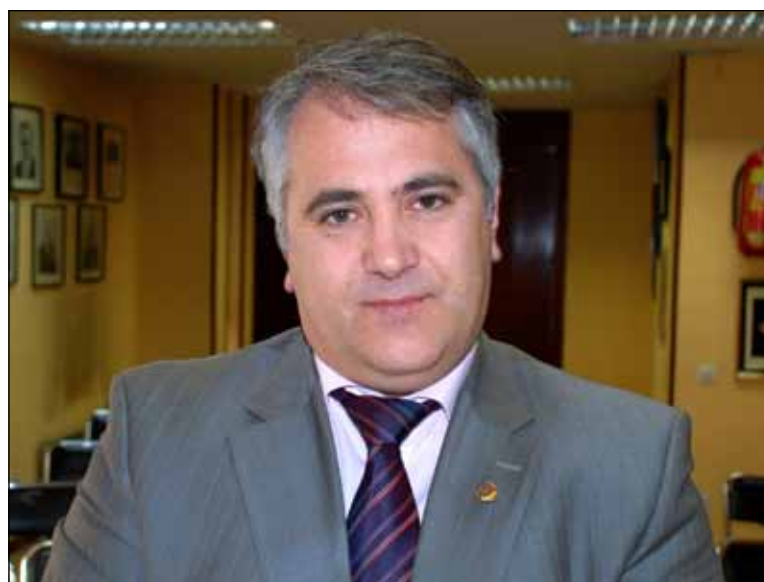
Senatorul PDL pentru românii din Europa și Asia, Viorel BADEA

Senzația mea este că din noiembrie încoace lucrurile s-au schimbat fundamental și la nivelul abordării statului român în fața acestor probleme. Dacă urmărești campania mea electorală, ai văzut că spuneam că cea mai importantă resursă a României în momentul acesta sunt românii de afară, din foarte multe puncte de vedere. În primul rând, ei și-au asumat altfel educația muncii, se relaționează altfel cu cei din jur, puterea cuvântului dat este alta... Vă spun asta pentru că