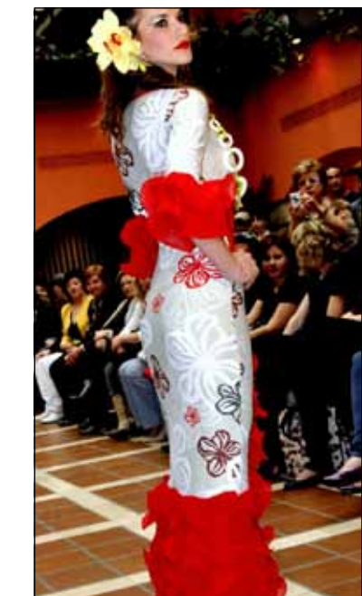
Moda flamenco le stă bine și românelor

rezultat am descoperit în moda flamenco, cel mai bun mijloc de a ne exprima ca și creatori de modă”, spun Augustin și Camelia pe blogul lor (augustinycameia.wordpress.com) unde se găsește și fotografiile de la eveniment.