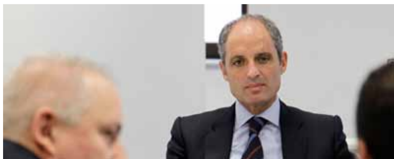
FRANCISCO CAMPS EN RUMANIA

El President de la Generalitat, Francisco Camps, ha afirmado que Rumanía abre la puerta a las empresas valencianas a un gran mercado de 200 millones de personas dada su privilegiada situación geográfica, en el cruce de caminos de las rutas comerciales tradicionales y con acceso directo a los mercados de Europa Central y del Este.