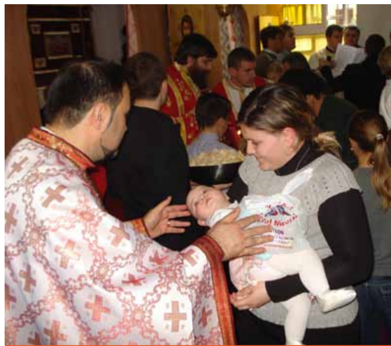
DE SFÂNTUL NICOLAE, COPIII AU PRIMIT DARURI DE LA BISERICĂ