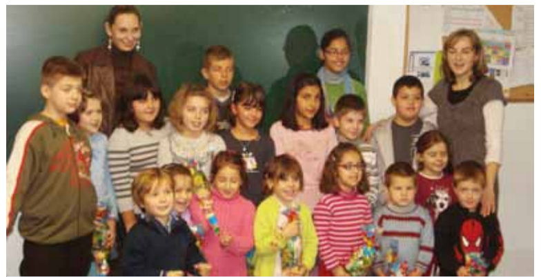
SERBAREA DE CRĂCIUN DE LA COLEGIUL LOPE DE VEGA