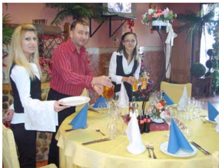
PREGĂTIREA MESELOR PENTRU REVELION

Înainte sărbătorilor de iarnă, toți românii ar vrea să fie acasă lângă cei dragi, dar dacă pentru foarte mulți dintre ei acest lucru este greu de realizat în acest an, totuși în Spania au toate mijloacele ca să petreacă un Crăciun românesc și un An Nou cu bucurie alături de compatrioți și prieteni spanioli.