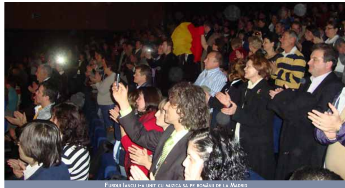
FURDUL IANCU I-A UNIT CU MUZICA SA PE ROMÂNII DE LA MADRID

Numeroase asociații românești din Spania, precum și biserici ale românilor au organizat în această perioadă, în multe orașe și sate spaniole,