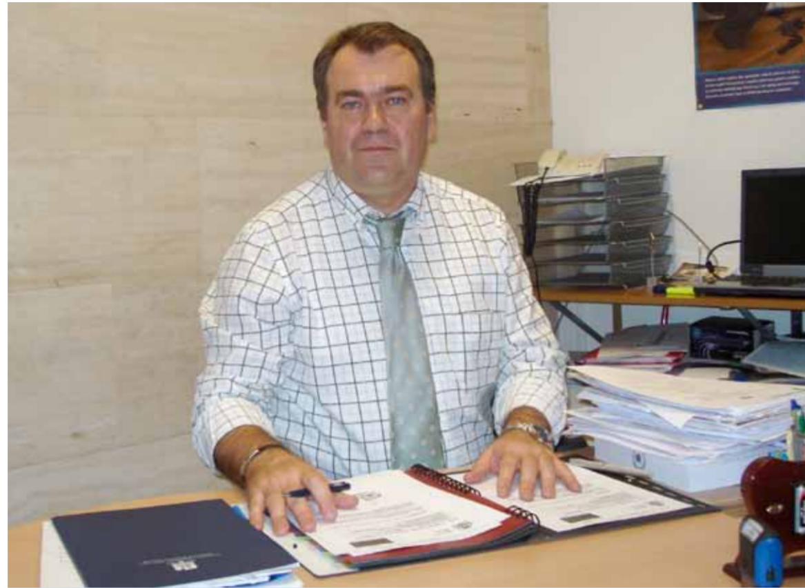
LIVIU POPA, CONSULUL ROMÂNIEI LA CASTELLON

Consul Liviu Popa: Activitatea la consulat este fluctuantă, depinde foarte mult de sărbători și de perioadele în care majoritatea românilor din Spania își iau concedii. Începem mai intens cu o lună înainte de Sfintele Paști. Pe timpul verii și până la jumătatea lui septembrie, ca medie, numărul românilor care solicită servicii consulare este triplu față de celelalte perioade ale anului. Luna decembrie este, de asemenea, foarte aglomerată. Luna octombrie a fost una dintre lunile pe care noi le numim „liniștite”. Am eliberat „doar” 261 de titluri de călătorie, 50 de certificate de naștere -plus procurile necesare pentru cei care voiau să-și scoată certificatul în România, 184 de pașapoarte și 10 pașapoarte mortuare. Am acordat asistență unui număr de 69 de persoane reținute de autoritățile spaniole. Am oficiat 17 căsătorii și am