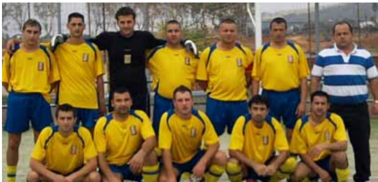
ECHIPA DE FOTBAL „LUCEAFĂRUL”, ÎNAINTEA UNUI MECI