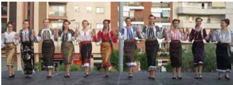
ANSAMBLUL „SUFLETE ROMÂNEȘTI” ÎN SPECTACOL

Toți românii care doresc să facă parte din ansamblul de dans popular „Suflete românești” sau din trupa de teatru a asociației AIPE sunt așteptați să se înscrie în aceste grupuri și să participe la repetiții și antrenamente. Doritorii pot suna la numărul de telefon 642.214.207.