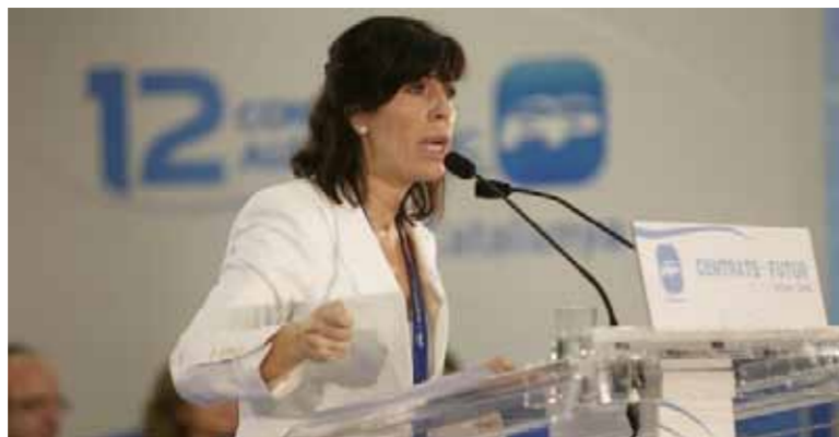
ALICIA SÁNCHEZ CAMACHO - PREȘEDINTE PP CATALUNIA

Candidata conservatorilor pentru parlamentul regional catalan a lansat, ieri, propunerea privind implementarea unui contract pentru imigranți. Alicia Sánchez Camacho a subliniat că acest contract îi obligă pe imigranți să respecte legile din regiune, să respecte valorile și obiceiurile locale, să învețe limbile oficiale din Catalonia, să plătească impozite, să se integreze și după o perioadă în care nu mai au un loc de muncă să se întoarcă în țara de origine.