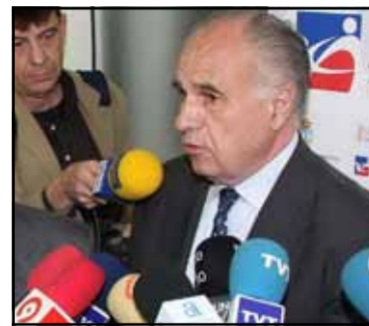
Rafael Blasco, ministru regional de Imigrație

Consilierul regional al Imigrației din Valencia, Rafael Blasco, crede că pentru aplicarea programului de limbă, cultură