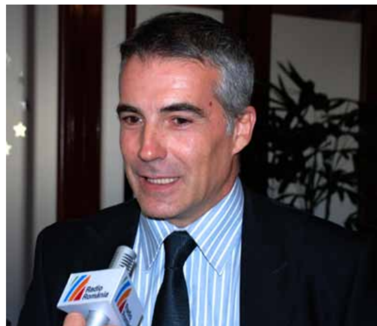
David Cantero - prezentator de știri la TVE