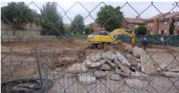
AU ÎNCEPUT LUCRĂRILE

în Alcalá, și comercial și administrativ, dar rigorile urbanistice ne obligă să nu depășim 15 metri înălțime. Atunci am decis împreună cu arhitectul că decât să construim o biserică foarte joasă și să ajungem cu un turn sau o cupulă la 15 metri, am ales să ridicăm nivelul bisericii și cupola să atingă 15 metri, iar restul bisericii să fie undeva în medie la 11 metri. Avem un turn cu o clopotniță la intrare în celălalt edificiu, pe sub care trec credincioșii ca să intre în biserică, dar ceea ce prima dată li s-a părut ciudat credincioșilor a fost că nu avem un turn în vârful bisericii, care să semene cu ceea ce avem acasă. Înăuntru