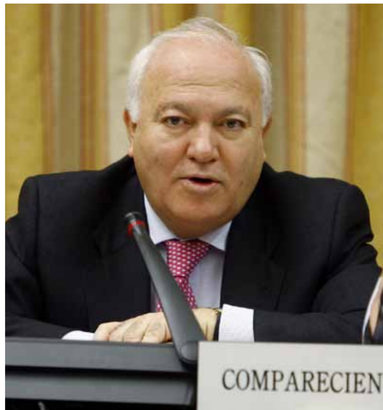
MINISTRUL AFACERILOR EXTERNE - MIGUEL ÁNGEL MORATINOS

Este o treime dintre spanioli au o opinie negativă despre evrei, în special din cauza conflictului din Orientul Mijlociu, relevă un sondaj publicat recent, proporție pe care ministrul spaniol al afacerilor externe o consideră „inacceptabilă”.