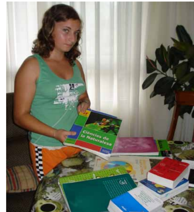
UN MANUAL DE CLASA A IX-A POATE AJUNGE ȘI LA 40 DE EURO

De asemenea, refolosirea materialului școlar aflat încă în stare bună scade costurile începutului de an școlar. Ghiozdanul sau penarul sunt doar două dintre rechizitele