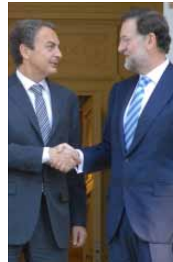
ZAPATERO ȘI RAJOY LA ULTIMA REUNIUNE LA MONCLOA

De asemenea, potrivit ultimelor sondaje realizate de Sigma Dos și citate de 20 Minutos, IU și UPyD ar urca cu câteva puncte procentajul de alegători. În același timp, sondajul arată că 50% dintre