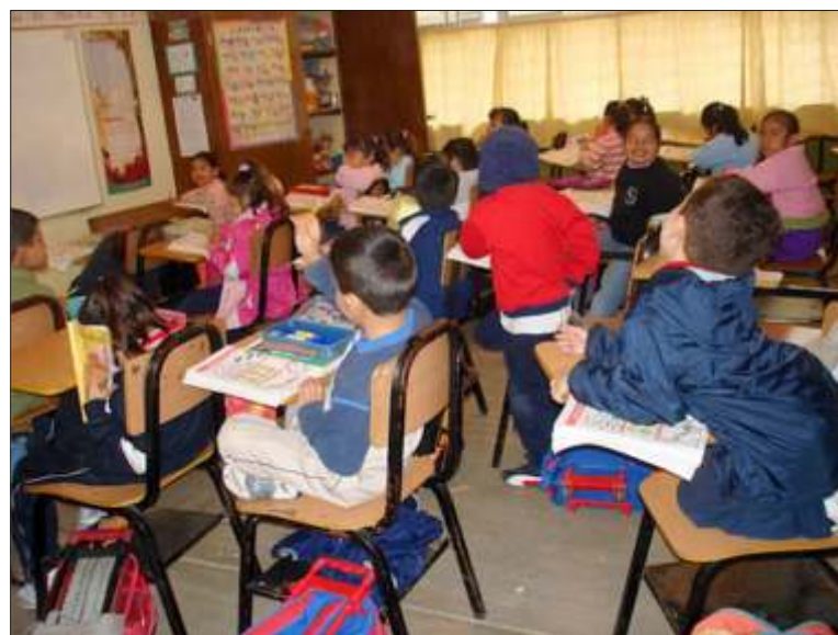
Zeci de mii de copii români din Spania au nevoie de limba română pentru a nu fi niște inadaptați în cazul întoarcerii acasă