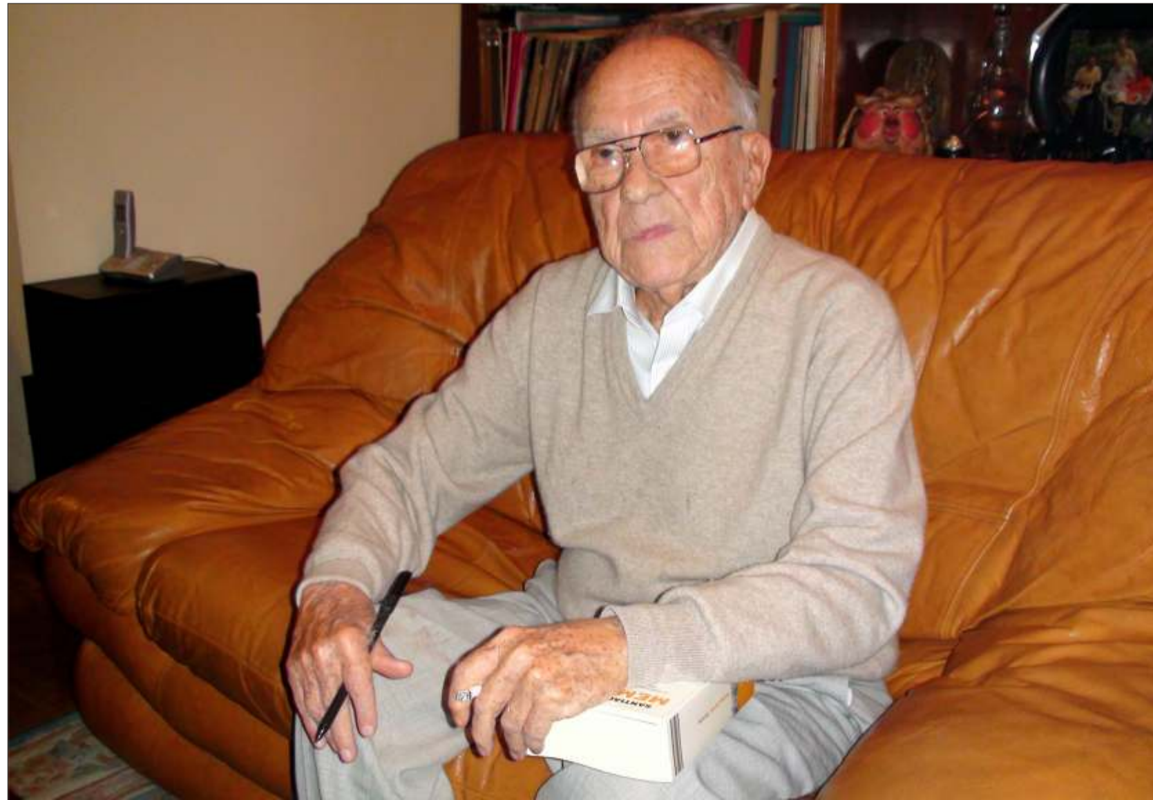
Comunist, fumător pasionat și analist politic lucid, Santiago Carillo, astăzi în vârstă de 94 de ani, este una dintre figurile istorice ale Spaniei și unul dintre pilonii Tranziției spaniole. O figura respectată sau temută de diversele regimuri politice, scriitor și ziarist, un interlocutor de excepție, un personaj cu care orice curios de profesie vrea să stea de vorbă măcar câteva minute. Pentru noi faptul că l-a cunoscut pe Ceaușescu a fost un motiv în plus ca să-i cerem să ne primească. Don Santiago ne-a primit, generos, în casa domniei sale, un apartament obișnuit în apropiere de Retiro și cu o vedere extraordinară către sud. Am ajuns aici după ce i-am descoperit „Memoriile” (ediția 2008), volum în care unul dintre capitele este dedicat lui Nicolae Ceaușescu.

Eu am început să râd și le-am spus celor de la masă: Chiar datoriile către toate firmele