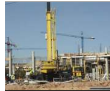
Șantierul în care s-a produs accidentul

Accidentul este anchetat de specialiști din cadrul Institutului pentru Sănătate și Siguranță la locul de muncă din