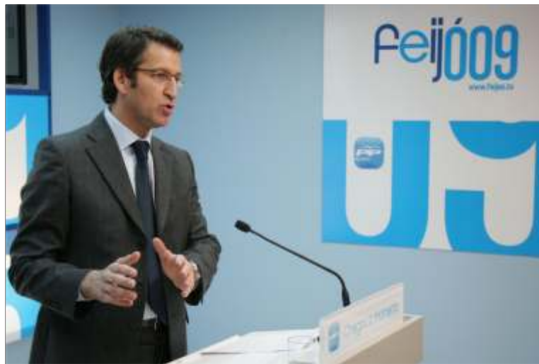
Alberto Nuñez Feijoo

Rezultatul alegerilor regionale din 1 martie schimbă configurația politică în cele două regiuni, unde au votat peste 3 milioane de persoane