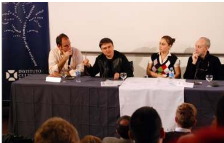
Cristian Mungiu le-a vorbit spaniolilor despre felul în care a regizat „4,3,2”

filmului din România, Mungiu a spus că în ciuda aparențelor, filmul românesc nu este simpatizat în România și că nu se acordă un sprijin prea mare din partea Statului pentru cinematografie. „Dacă ne uităm la cifre, putem spune că nu e o mare simpatie pentru film în România. Lumea merge foarte puțin la cinematograful și vede foarte puțin film. Există o oarecare simpatie pentru că au existat succesele astea recente și ne hrănim cu satisfacția orgoliului că am câștigat ceva. Avem un sentiment sportiv, ca la Olimpiadă. Sunt mai mulți