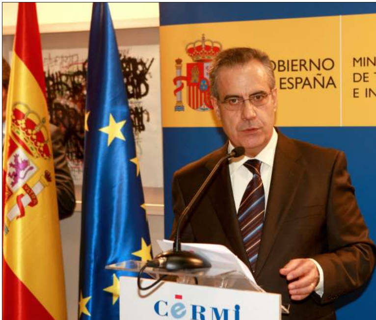
Corbacho vrea sprijin din partea Guvernului României pentru întoarcerea românilor șomeri