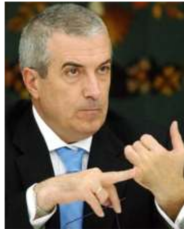
Călin Popescu Tăriceanu

Potrivit președintelui PNL, „nu există nici un fel de condiționare” care să oblige România să încheie un acord cu