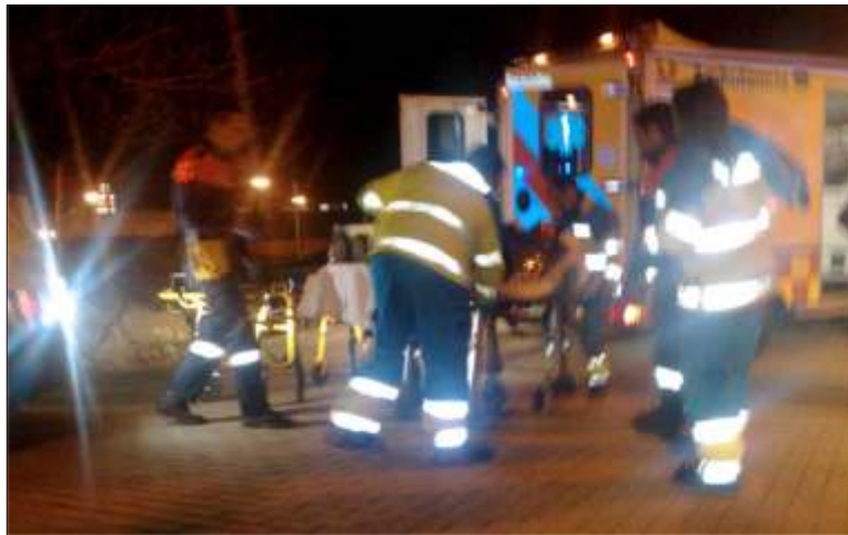
Medicii Serviciului de Urgență SAMUR le-au acordat primul ajutor celor doi români