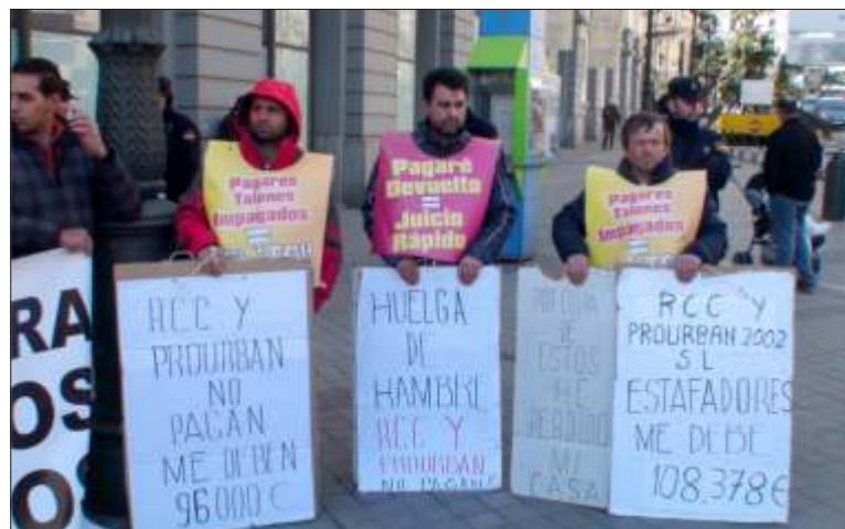
Criza economică și cecurile neacoperite îi aduc pe patronii români la sapă de lemn