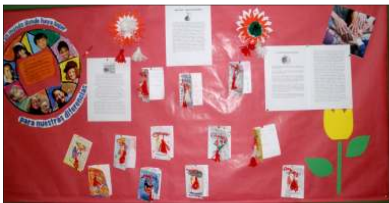
Expoziție de 1 martie - elevii învață să-și păstreze tradițiile cu ajutorul profesorilor și fără manuale

Între timp, însă, copiii românilor din Spania pierd ceea ce au mai de preț: limba, cultura și civilizația română.