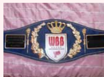
CENTURA DE CAMPION INTERCONTINENTAL