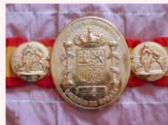
CENTURA DE CAMPION AL SPANIEI

A.L.: -Vreau să le spun cititorilor ziarului „Românul” și tuturor românilor din Spania că mi-ar plăcea să vadă cu toții meciul pentru titlul mondial și să mă sprijine în felul acesta, pentru că eu îi reprezint și pe ei, reprezint România, iar pentru mine e foarte important să mă