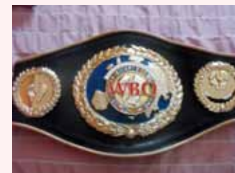
CENTURA DE CAMPION EUROPEAN