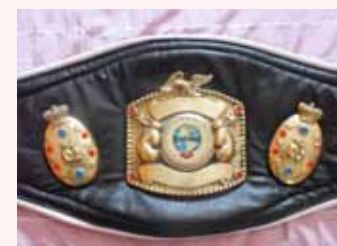
CENTURA DE CAMPION MUNDO LATINO

Noi avem sportivi în România care sunt foarte buni nu numai în box, ci și în multe alte sporturi, dar care din păcate nu au aceleași posibilități ca în alte părți