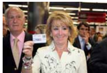
ESPERANZA AGUIRRE - PREȘEDINTELE COMUNITĂȚII MADRID

o bandă magnetică în care se stochează datele utilizatorului și sunt foarte bune, dar potrivit autorităților madrilene, „posibilitățile pe care ni le oferă azi tehnologia ne-au făcut să proiectăm acest sistem care este