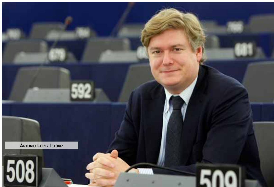
ANTONIO LÓPEZ ISTÚRIZ

- Cred că sunt declarații total nefericite, la fel ca și pliantul acela. Dacă sunt adevărate și întocmai, eu nu le-am auzit, repet, sunt nefericite și nu au nici o legătură cu realitatea. Procesul de integrare a romilor în Spania, înainte să vină cei din România, a fost unul de succes de-a lungul anilor și această populație nu reprezintă un procent important de infractori sau de mafii organizate. Dimpotrivă. De asemenea, ar trebui să ne uităm cine stă în spatele acestor grupuri obscure, care, de multe ori, pătează imaginea unei comunități, în alte țări mai mult decât în Spania, cum e cazul românilor din Italia. În Spania, acțiunile unora, puțini la număr, afectează negativ imaginea celor mulți. Aceste