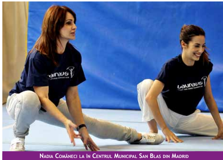
NADIA COMĂNECHI LA ÎN CENTRUL MUNICIPAL SAN BLAS DIN MADRID

de fetele noastre nu sunt deloc rele, trebuie să recunoaștem că nivelul gimnasticii românești a scăzut enorm. România duce dorul marilor performanțe obținute de Nadia Comănechi care săptămâna trecută tocmai a trecut prin Madrid. Împreună cu Almudena Cid, fostă mare gimnastă olimpică spaniolă, Nadia a vizitat Centrul Municipal San Blas din Madrid unde a petrecut câteva momente cu tinerile gimnaste de acolo. Prin această vizită se dorește atât sprijinirea tinerelor speranțe sportive cât și promovarea unei ramuri de activitate a Fundației Laureus Spania prin care se dorește încurajarea activităților sportive ca mod eficient de combatere a sedentarismului și obezității infantile.