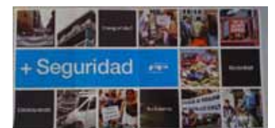
PLIANTUL ÎMPĂRȚIT LA BADALONA

Mai multe asociații ale țiganilor au denunțat acțiunea xenofobă și rasistă a popularului Xavi Albiol, iar Guvernul Cataluniei studiază posibilitatea de a-l da în judecată pe inițiatorul acțiunii pentru instigare la ură rasială. Odată cu trecerea zilelor însă, s-au găsit și aliați pentru liderul popular Xavi Albiol, care a ajuns să fie susținut la un moment dat chiar de o organizație a țiganilor spanioli care îi resping pe cei din România, tocmai pentru aceleași motive invocate de acesta.