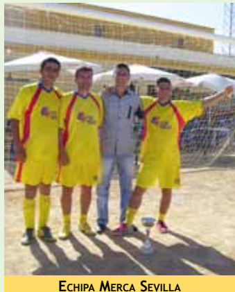
ECHIPA MERCA SEVILLA

au un loc de muncă, chiar dacă este vorba de muncă în câmp, la cules de fructe și legume, o muncă nu prea agreată de spanioli. Câștigă zilnic între 40 și 50 de euro, bani pe care în țară nu prea aveau cum să-i câștige muncind la fel.