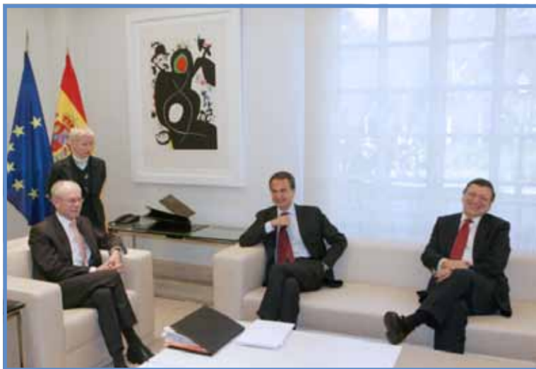
ROMPUȘ, ZAPATERO ȘI BARROSO VOR O STRATEGIE PENTRU SFÂRȘITUL CRIZEI ECONOMICE

în Europa este acesta. „Dacă nu este posibil acum să avem definită această strategie, nu va fi posibil niciodată”, a precizat Barroso. Ideea principală este crearea unui model economic bazat pe competitivitate, pentru a depăși situația de plafonare la o creștere economică de maxim 1%, ceea ce experimentează guvernele Uniunii Europene în următoarea perioadă.