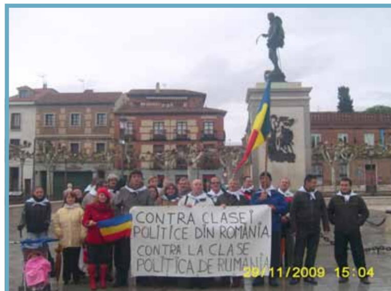
PANĂ ACUM APROXIMATIV 30 DE PERSOANE AU DECIS SĂ SE ÎNTĂLNEASCĂ ÎN FIECARE LUNĂ ÎN CENTRUL ORAȘULUI LUI CERVANTES

O mână de români protestează periodic în Plaza Cervantes din Alcalá de Henares față de acțiunile clasei politice din România.