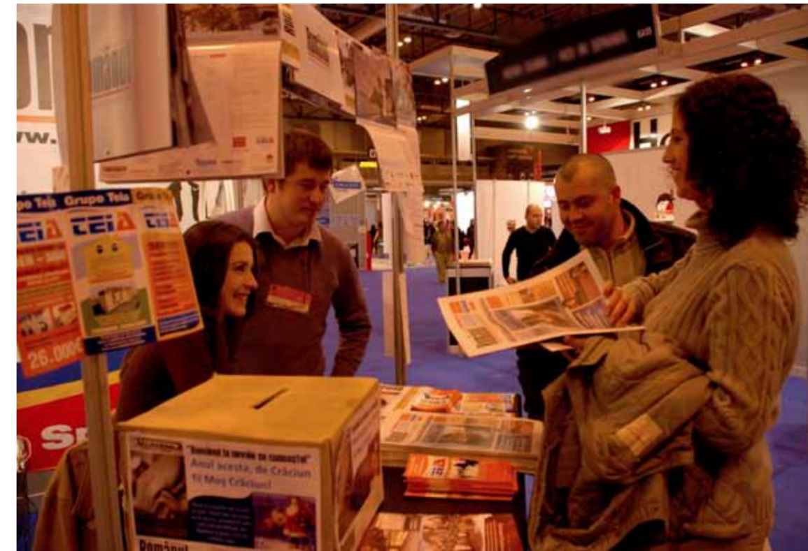
STANDUL NOSTRU A FOST DEMN DE PRIMA PARTICIPARE LA TÂRGUL DE PRODUSE ȘI SERVICII PENTRU IMIGRANȚI INTEGRA ȘI A FOST O GAZDĂ PRIMITOARE PENTRU TOȚI VIZITATORII

Pentru că Românu trebuie să fie ceea ce se numește, adică un ziar al românilor și un îndemn