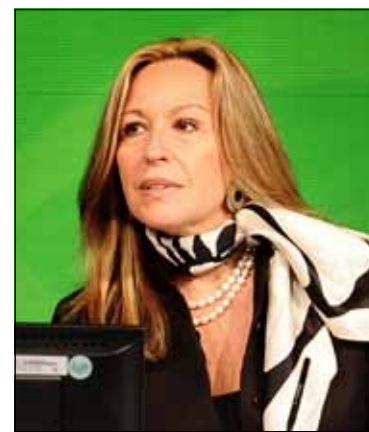
MINISTRUL SPANIOL AL SĂNĂTĂȚII, TRINIDAD JIMENEZ.

privind vaccinarea se difuzează pe toate canalele mass media, audio, în presa scrisă, pe internet și la punctele de vânzare de loterie, frecventate în această perioadă, de foarte multă lume. Autoritățile sanitare prevăd ca imunizarea să se facă la 15-20 % din populație și să dureze o lună și jumătate. Până acum, în Spania, 97% dintre cazurile detectate de gripă au fost provocate de virusul AH1N1 și din luna aprilie a acestui an, când au apărut primele cazuri, au murit 88 de persoane.