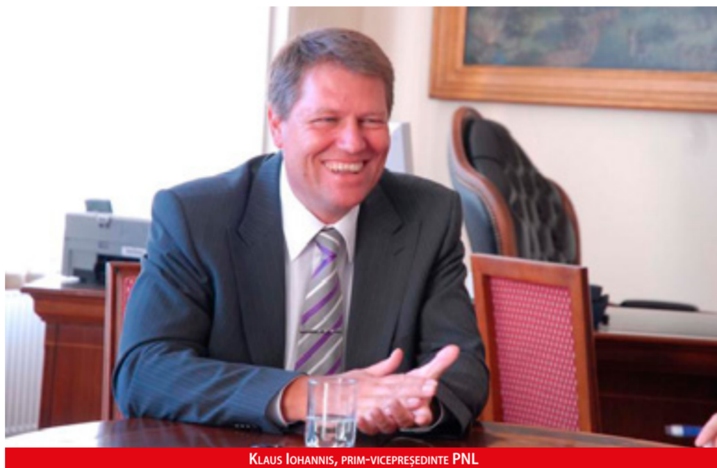
KLAUS IOHANNIS, PRIM-VICEPREȘEDINTE PNL

Investițiile directe ale rezidenților români în străinătate totalizau 1,099 miliarde euro, la 31 decembrie 2012, din care participațiile la capital erau de 432 milioane euro, informează Banca Națională în statistica privind poziția investițională internațională a României, publicată în luna februarie, pe pagina sa de Internet.