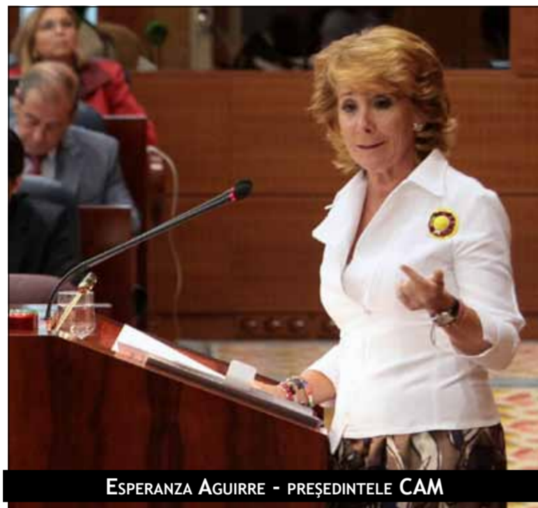
ESPERANZA AGUIRRE - PREȘEDINTELE CAM

La sfârșitul dezbaterilor, popularii au criticat „incetinea și întârzierile privind omologarea diplomelor, care apar la Ministerului Educației”, considerând că acestea creează mari probleme tuturor noilor madrileni. „Mulți străni sunt obligați să muncească în posturi care sunt cu mult sub pregătirea lor academică, pentru că diploma nu le este recunoscută, în mod oficial, de autoritățile spaniole și drept urmare aptitudinile lor rămân nevalorificate, iar câștigurile le sunt afectate de acest lucru. De aceea, Partidul Popular Madrid, în frunte cu Esperanza Aguirre, consideră că această situație este injustă și trebuie remediată cât mai curând”, precizează popularii