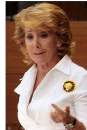
ESPERANZA AGUIRRE - PREȘEDINTELE GUVERNULUI COMUNITĂȚII MADRID

Lasquetty, care a pus în mișcare recent un Plan de Integrare Regională care va asigura „o conviețuire fără discriminări, fără avantaje, în egalitate de șanse și coeziune socială”. Președintele guvernului Comunității Madridului a precizat și faptul că acest plan care se va derula pe câțiva ani, este finanțat cu 7,4 miliarde de euro, fiind cea mai mare investiție din Spania în politica de integrare a străinilor.