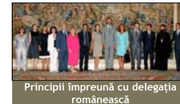
Principii împreună cu delegația românească

Potrivit sitului Ambasadei, în cadrul întâlnirii, principii Felipe și Letizia au reiterat interesul Casei Regale pentru integrarea comunității românești, subliniind importanța păstrării culturii, limbii și tradițiilor precum și contribuția pe care românii o au la viața economică și socială spaniolă.