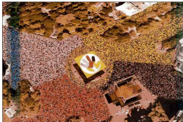
Mozaic uman pentru susținerea candidaturii olimpice Madrid 2016

Zeci mii de oameni au realizat un mozaic uman în fața primăriei Madridului pentru susținerea candidaturii orașului pentru găzduirea Jocurilor Olimpice din 2016. Acțiunea a fost organizată la un apel al primăriei care i-a chemat pe madrileni în centrul orașului, la glorieta Cibeles, în fața sediului municipalității.