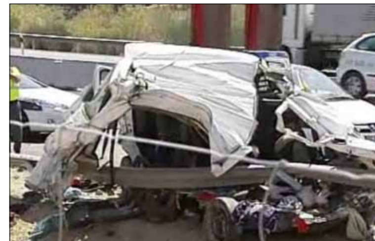
Impactul a transformat mașina într-un morman de fiare

Corpurile celor 6 români, care mergeau la cules de struguri în regiunea Valdepeñas, vor pleca de la Valencia și după escalele de