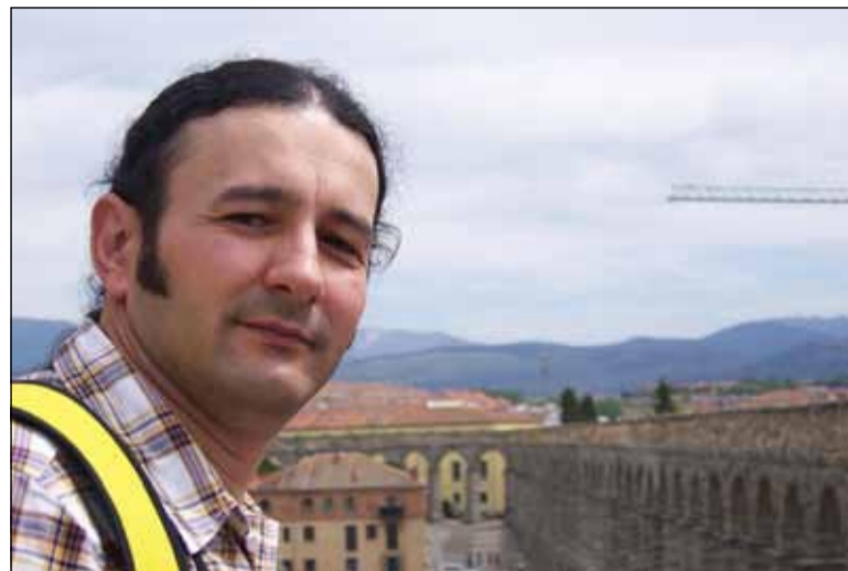
GELU VLAȘIN - UN POET „RĂTĂCITOR” ÎN SPANIA