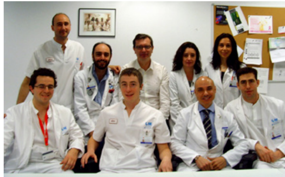
Echipe de medici de la Secția de Chirurgie a Obezității de la Spitalul Universitar din Torrejón

Nu există reguli magice. Obezitatea morbidă pune organismul într-o situație atât de complicată încât, pentru a fi depășită, este necesar concursul unei echipe de chirurzi și medici specialiști care