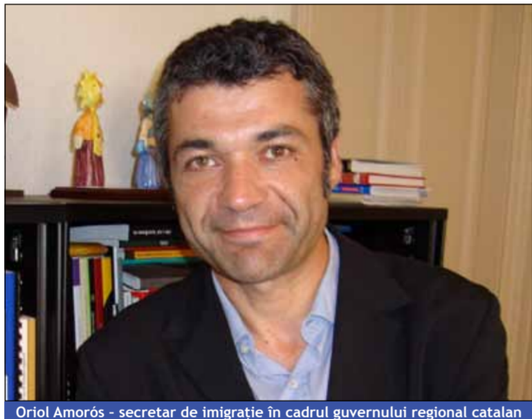
Oriol Amorós - secretar de imigrație în cadrul guvernului regional catalan

Oriol Amorós: - Formarea profesională. Ieșirea din criză este formarea. Aceasta nu este doar o criză financiară, de tip ciclic. Este o criză profundă care afectează modelul productiv în care unele sectoare au avut o