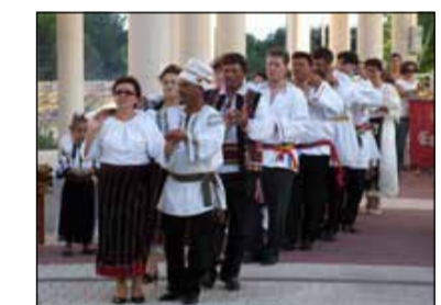
Românii din Calp au asociație

Asociația a fost prezentată de oficialitățile locale ca fiind un instrument necesar pentru