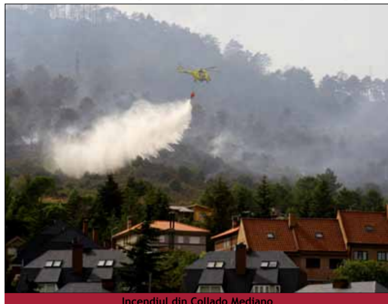
Incendiul din Collado Mediano

Incendiul s-a declanșat cu în parcul natural Els Port, în apropiere de Tarragona și se apropia localitatea Horta de Sant Joan, unde a avut loc tragedia.