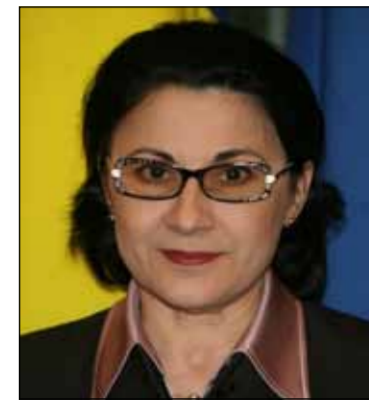
Ecaterina Andronescu - ministrul Educației

Controlul la „Spiru Haret” a început în 17 iulie. Ministerul Educației, Cercetării și Inovării (MECI) a publicat lista specializărilor, programelor de studii, formelor de învățământ (zi, învățământ cu frecvență