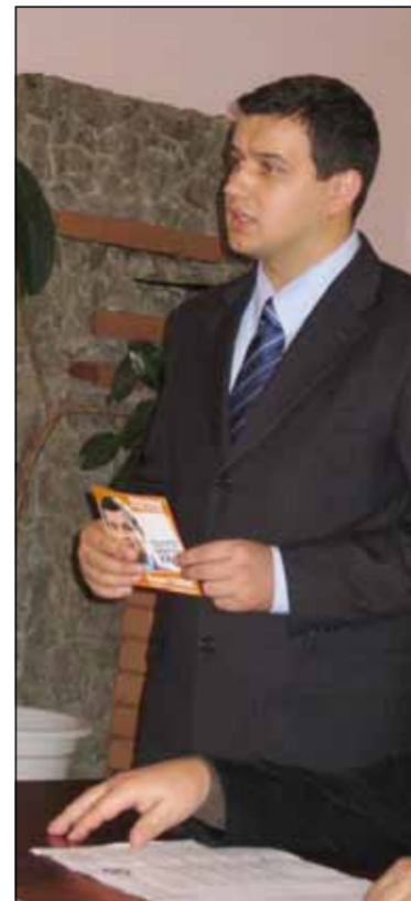
Eugen Tomac - directorul Departamentului pentru Relațiile cu Românii de Pretutindeni

„Comunitatea românească din jurul granițelor și din Balcani este cu mult mai numeroasă decât comunitățile din emigrație, iar problematica