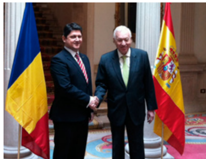
Ministrul de Externe Titus Corlățean și omologul său, José Manuel García-Margallo