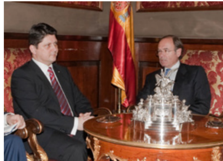
Reuniune între Titus Corlățean și președintele Senatului, Pío García-Escudero.

Cei doi demnitari au avut un schimb de opinii privind viitoarele alegeri euro-parlamentare din mai 2014 împărțind opinia că aceste evoluții instituționale vor constitui un test al încrederii cetățenilor europeni în UE. A fost subliniată importanța unui mesaj credibil din partea Uniunii în acest context, axat pe promovarea unei agende pro-europene, prin găsirea unor răspunsuri europene la preocupări actuale ale electoratului: creștere economică, crearea de noi locuri de muncă, consolidarea dimensiunii sociale a acțiunii europene, securitate. Totodată, interlocutorii au avut un schimb de opinii asupra evoluțiilor recente din Ucraina.