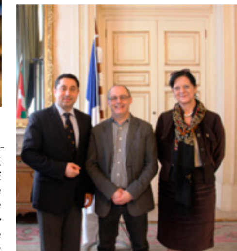
Întâlnire cu primarul orașului San Sebastian