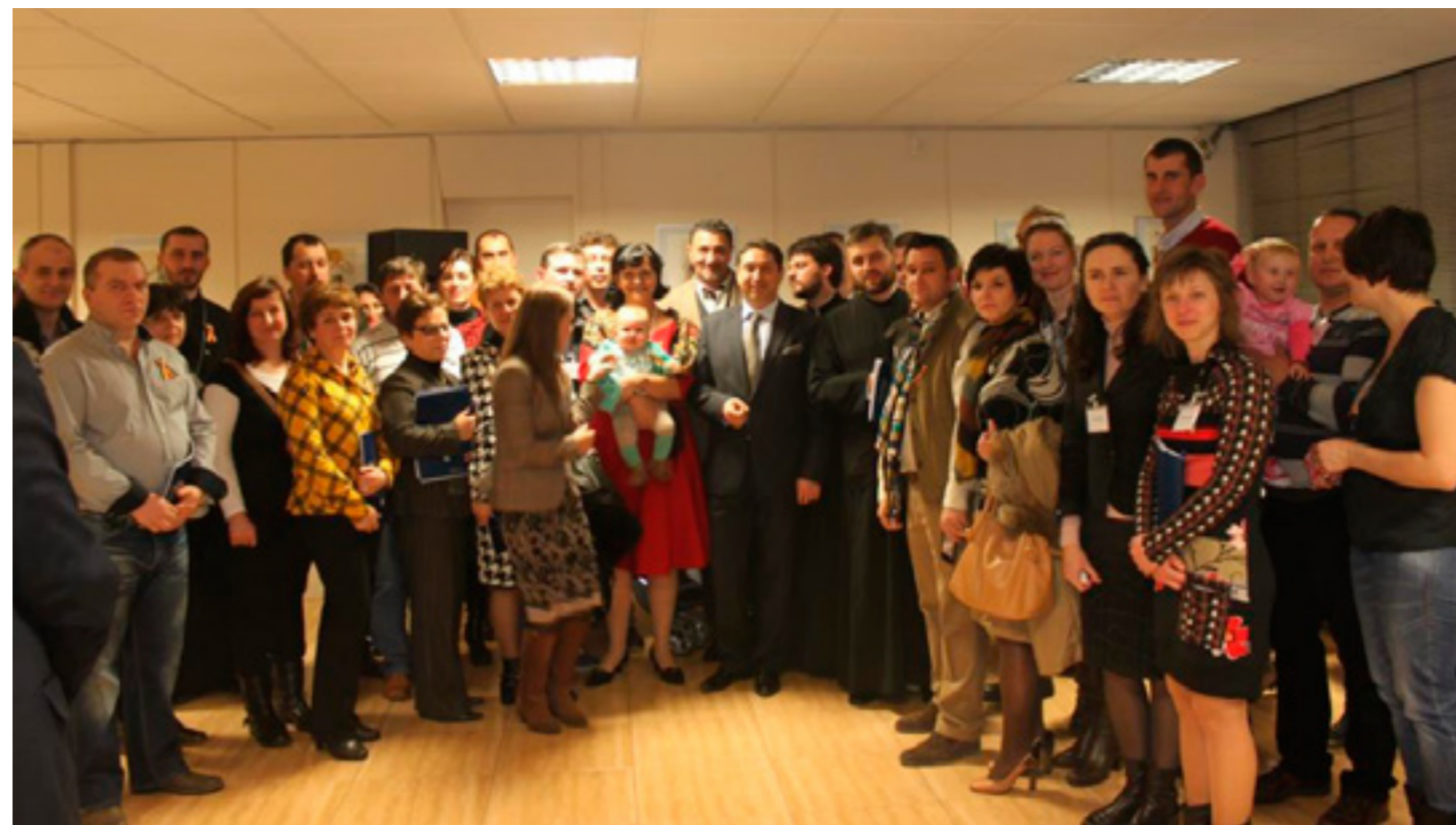
Bilbao-Reuniune cu românii

„Reuniunea cu ministrul muncii și securității sociale, Fátima Bañez, a oferit ocazia evidențierii importanței cooperării în domeniul muncii și afacerilor sociale, domenii prioritare pe agenda bilaterală din perioada următoare. Partea spaniolă a propus aprofundarea cooperării în proiecte concrete în domeniul precum: strategii de combatere a șomajului în rândul tinerilor, recunoașterea și certificarea experienței profesionale dobândite în Spania de către românii care doresc să se reîntoarcă în țară, schimb de bune practici în combaterea șomajului”, mai precizează Ambasada României. Cu ocazia întrevederii avute cu secretarul de stat pentru UE, în cadrul Ministerului Afacerilor