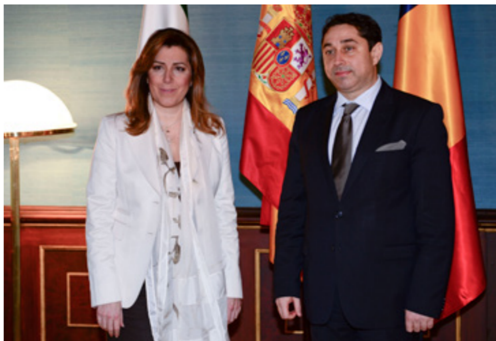
Întâlnire cu Susana Diaz, președintele Andaluciei

În zilele de 12 și 13 februarie 2014, Ministrul delegat pentru românii de pretutindeni și-a