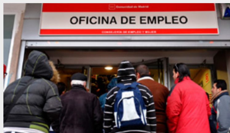
Birou de Muncă

Guvernul spaniol se laudă cu posibilă recuperare economică a Spaniei în acest an, însă numărul celor care rămân fără slujbă continuă să crească.