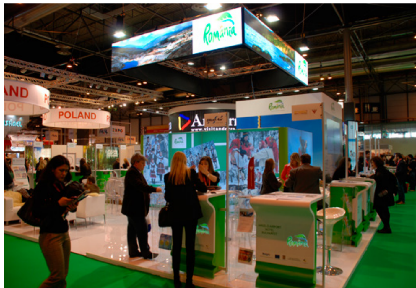
Standul României la FITUR 2014

Turismul românesc a revenit anul acesta la târgul de la Madrid cu un stand mult mai atractiv decât cel din 2013 și cu un număr important de turoperatori.