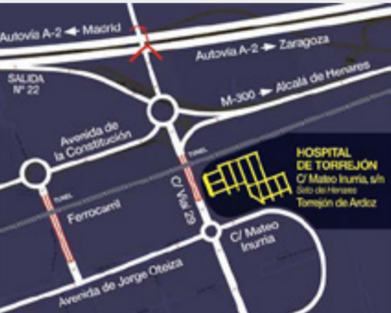
Hartă acces spital

- Dacă sunteți deja văzut într-un spital și doriți să veniți la Spitalul din Torrejón este simplu. Luați legătura cu Secția de Internă a spitalului respectiv (Unidad de Admisión) și explicați faptul că doriți să primiți o programare la un medic din Spitalul Universitar din Torrejón. Ei vor procesa solicitarea dvs. și vă vor prezenta documentul numit „Parte de Interconsulta”.