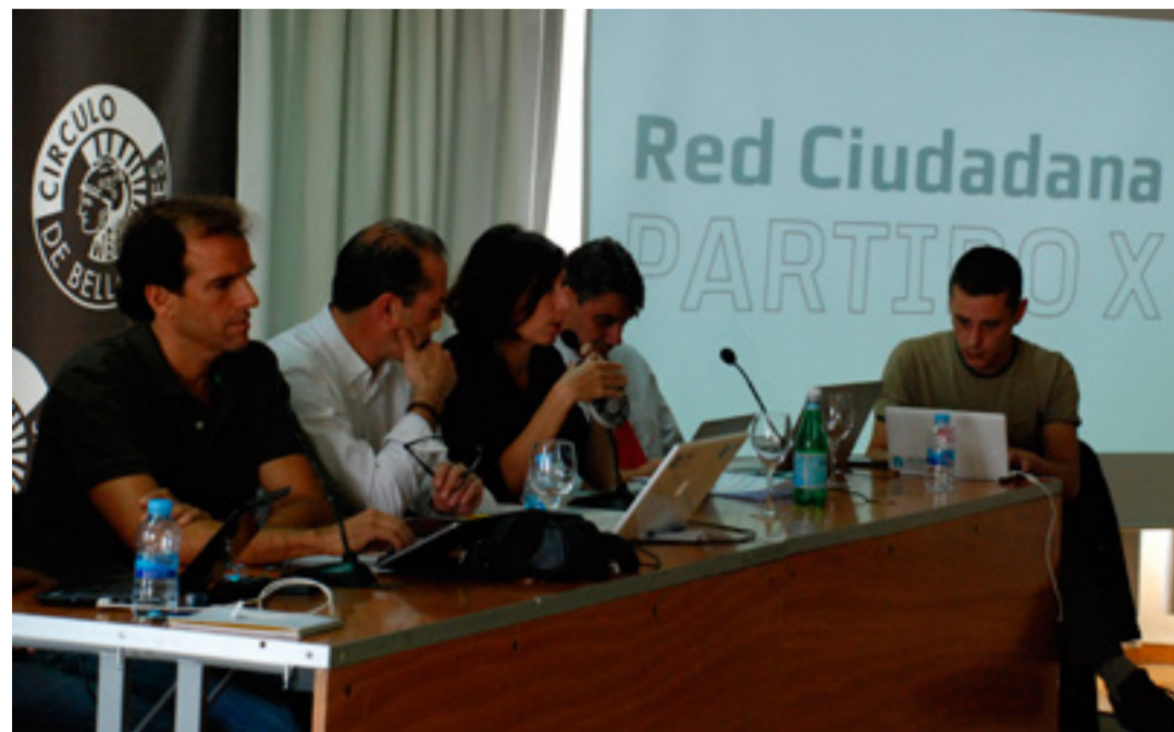
Prezentarea Partidului X

Au avut loc lansări similare în mai multe orașe din Spania, la care membrii Partidului X au explicat celor prezenți la ce a lucrat până acum Mișcarea Indignaților.