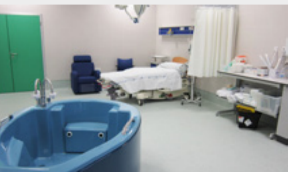
Săli de naștere în apă la Spitalul din Torrejón de Ardoz

- Spitalul Universitar din Torrejón organizează Visitas Preparto pentru toate acele persoane care sunt interesate să cunoască dotările din maternitate, săliile de naștere, camerele în care vor fi internate și pot să discute cu medicii și cu asistentele. Dacă doriți să participați puteți întreba despre programul de vizită prin email la visitasguiaidas@torrejonsalud.org sau prin telefon la 91 626 26 26, unde veți primi toate informațiile. Următoarele vizite programate sunt în 31 octombrie, de la ora 10, și în luna noiembrie, în 8 și 29 de la ora 10, iar în 12 și 20, de la ora 18. În data de 29 noiembrie vor fi primite 15 persoane per aula.