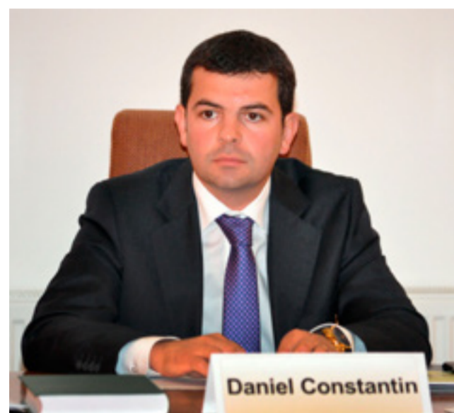
Daniel Constantin—ministrul agriculturii

vizită la Centrul Național al Tehnologiilor pentru Irigații (CENTER) din San Fernando de Henares.