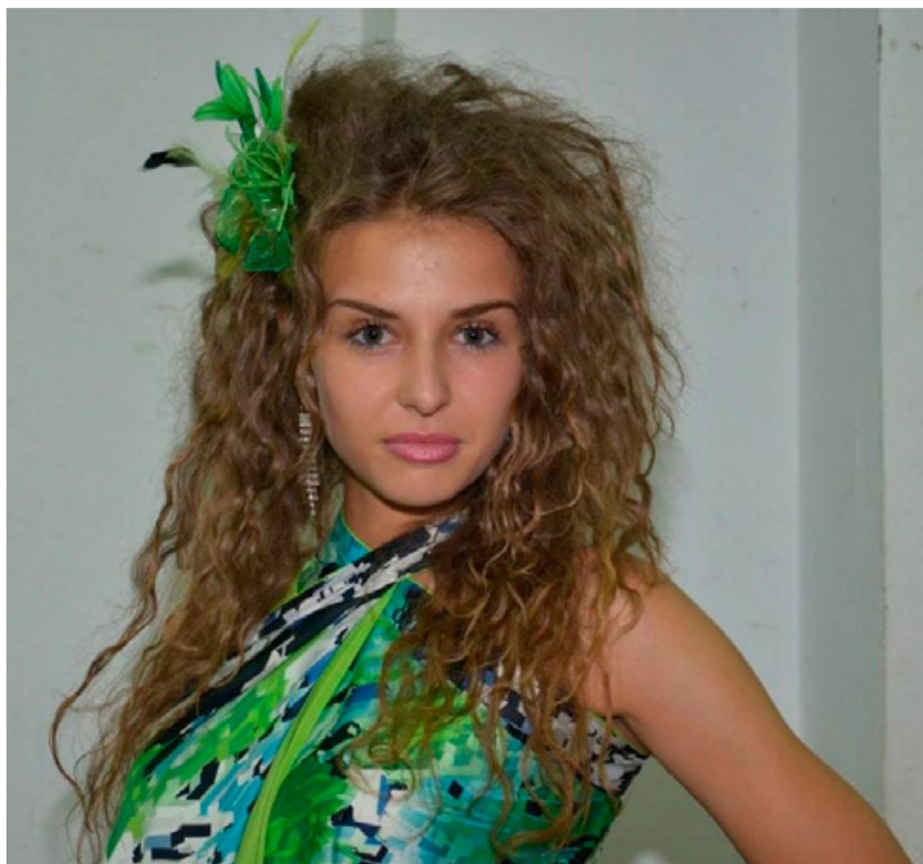
Castigatoare Locul I

Cu ocazia împlinirii a 3 ani de la momentul în care realizatorii au spus pentru prima dată „Bună dimineața!” pe 107,7 FM, Radio Românul a organizat concursul Miss Radio Românul și un concert aniversar oferit de Mirabela Dauer și Raoul, în 14 iulie, la Auditoriul “Paco de Lucia” din Alcalá de Henares.