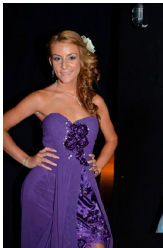
Castigatoare Locul III